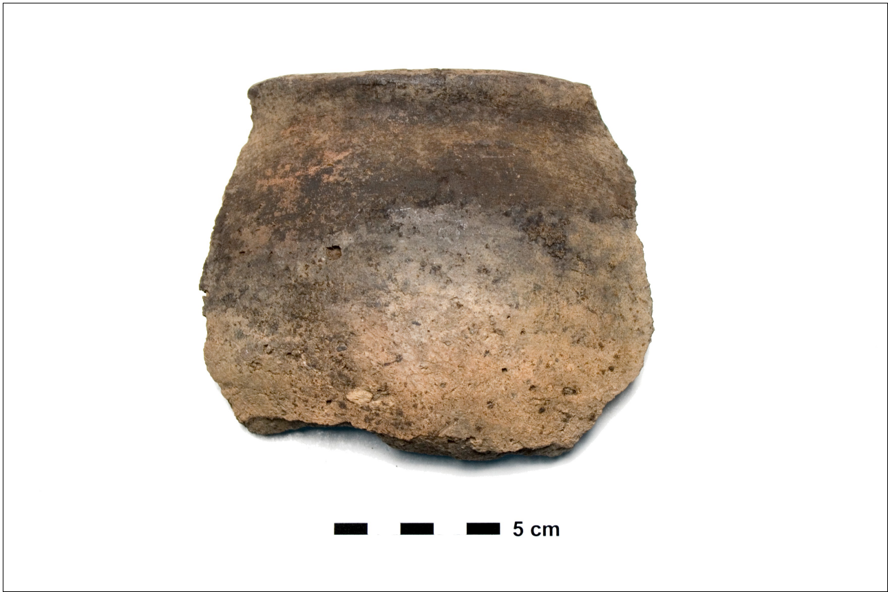
Figuur 8.1.5.45. Eelde, Groote Veen. Vondstnummer 567/1704: niet toegewezen aan een type, midden tot laat romeinse tijd, romeinse imitatie van RWIII.