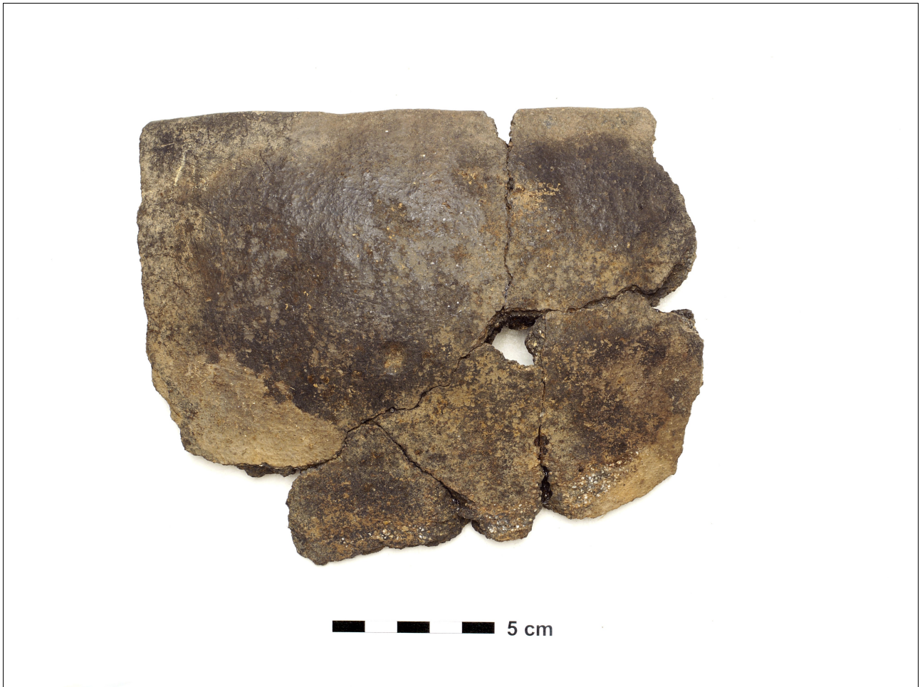
Figuur 8.1.5.44. Eelde, Groote Veen. Vondstnummer 5960/1312: een komvorm, geen nader type toe te wijzen, eerste eeuw nC of later.