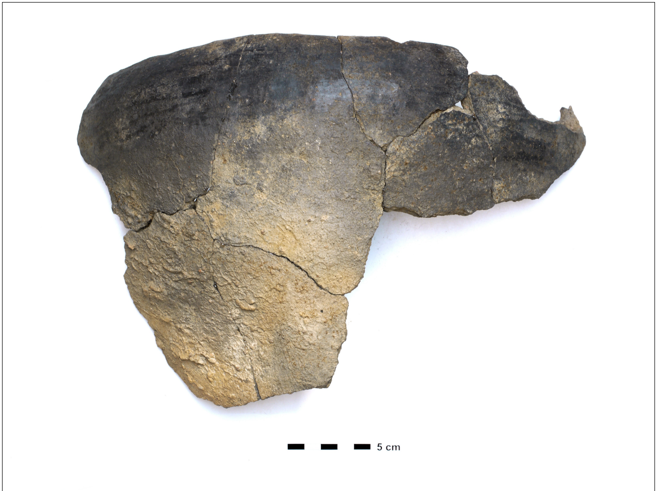
Figuur 8.1.5.53. Eelde, Groote Veen. Vondstnummer 498/1698: type S5, laat romeins, deels besmeten (chronogroep 13).