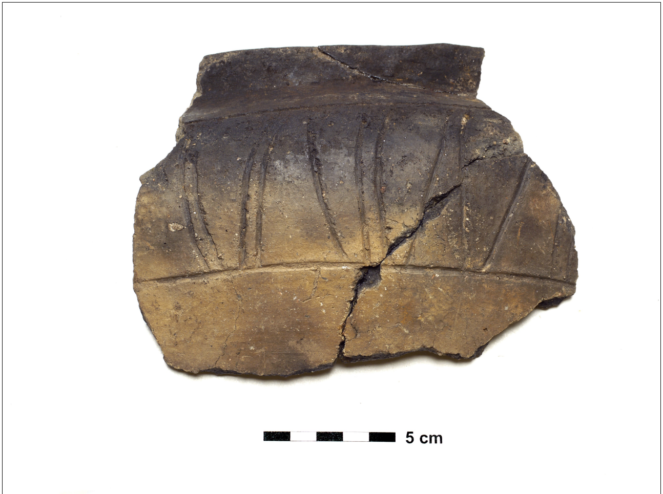
Figuur 8.1.5.3. Eelde, Grote Veen. Vondstnummer 5212/920: een rand met ingekrast strepenpatroon, type Gw5c, vroeg romeinse tijd.