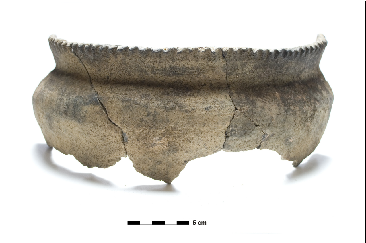
Figuur 8.1.5.21. Eelde, Groote Veen. Vondstnummer 567/1703: type V5, midden romeinse tijd. De pot is versierd met vinger-indrukken op de rand.