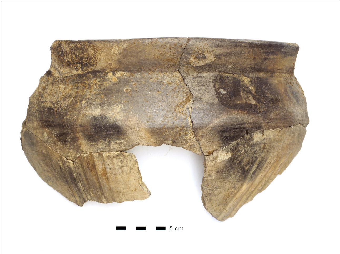
Figuur 8.1.5.35. Eelde, Groote Veen. Vondstnummer498/1688: type Gw6a, midden romeinse tijd (chrono-groep 13). Deze pot heeft verticale groeven.