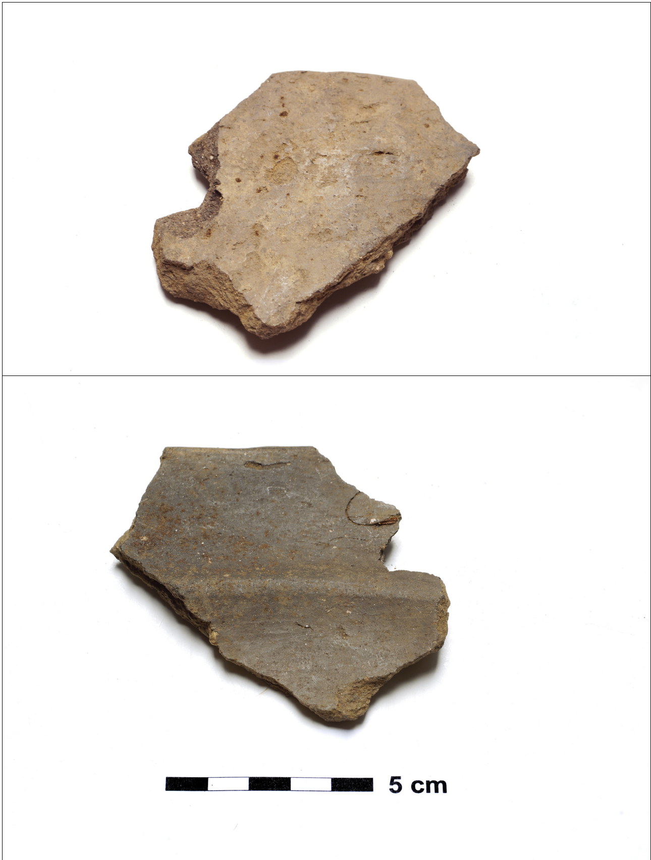
Figuur 8.1.4.7. Eelde, Grote Veen. Vondstnummer 2888/?, randscherf type S1, midden ijzertijd (chrono-groep 4). Boven de buitenkant en onder de binnenkant met een duidelijke knik.