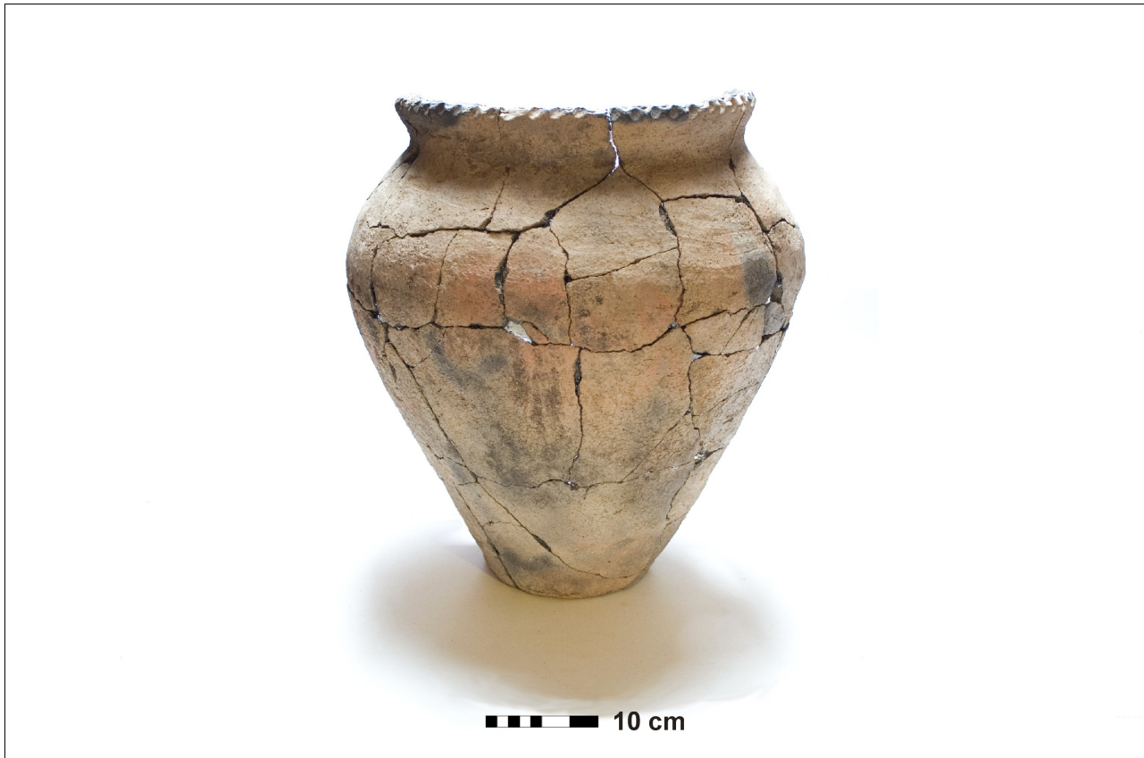
Figuur 8.1.5.23. Eelde, Groote Veen. Vondstnummer 220/1705: type V5, midden romeinse tijd. Ook deze pot heeft vinger-indrukken op de rand.