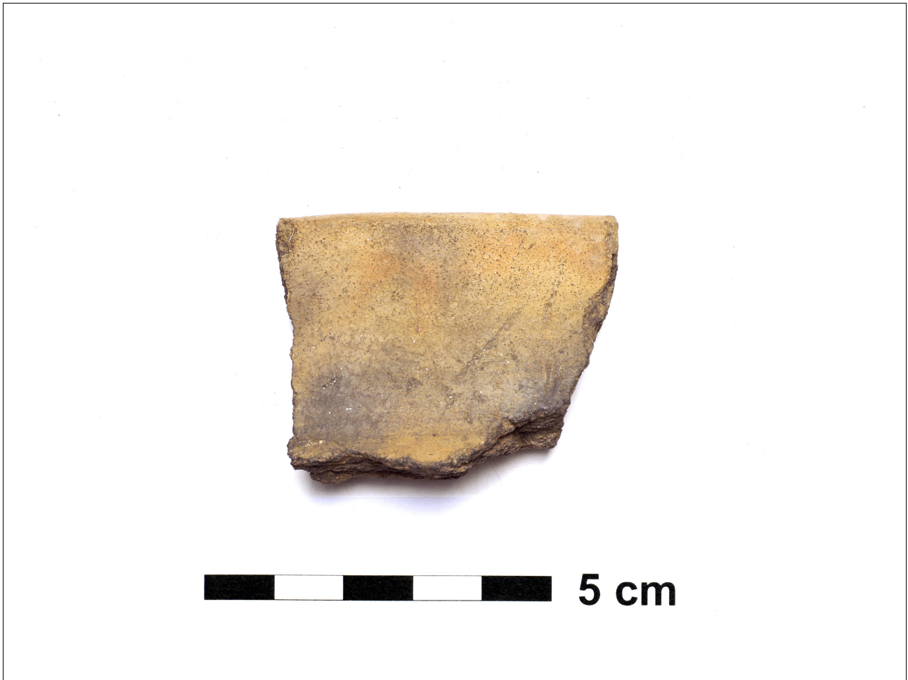
Figuur 8.1.5.17. Eelde, Groote Veen. Vondstnummer 1158/1681: type Gw6b, midden romeinse tijd (chronogroep 11).