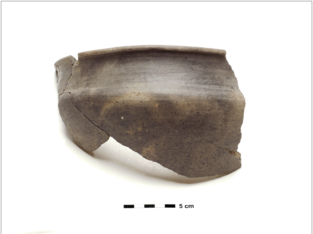
Figuur 8.1.5.42 Eelde, Grote Veen. Vondstnummer 3260/695: type K4b, lijkt op RheinWeserGermaans USLAR II aardewerk, midden tot laat romeinse tijd (chrono-groep 13).