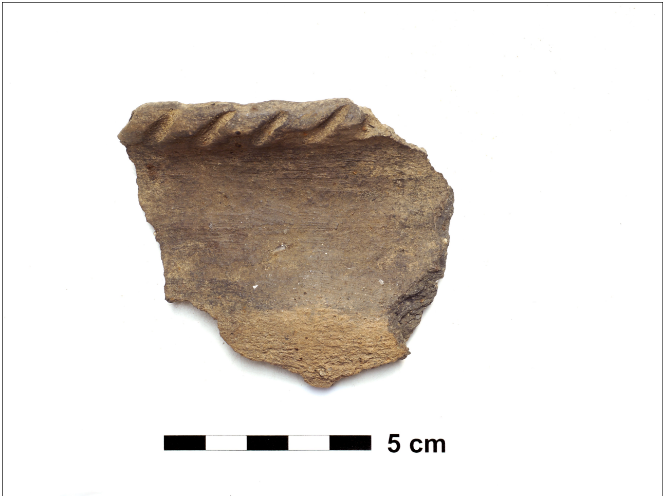
Figuur 8.1.5.39. Eelde, Grote Veen. Vondstnummer 821/1484: type late V5. Indrukken op de rand, verder besmeten en horizontaal gebezemd, laat romeinse tijd (chrono-groep 13).