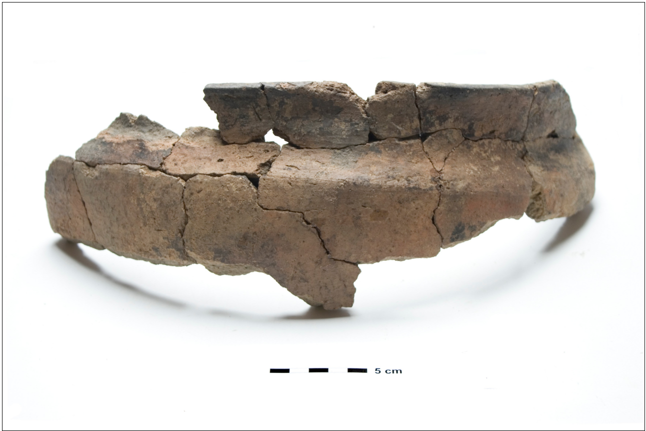
Figuur 8.1.5.34. Eelde, Groote Veen. Vondstnummer 198/1707: type Gw6?, midden tot laat romeinse tijd. Deze pot heeft een knik en een uitstaande rand.