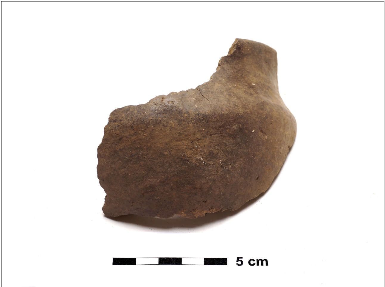
Figuur 8.1.4.4. Eelde, Groote Veen. Vondstnummer 2888/451, randscherf type G3, midden tot late ijzertijd (chrono-groep 4).