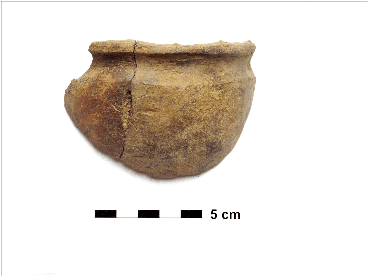
Figuur 8.1.5.6. Eelde, Grootte Veen. Vondstnummer 4659/839: type K2/K3, vroeg romeinse tijd.