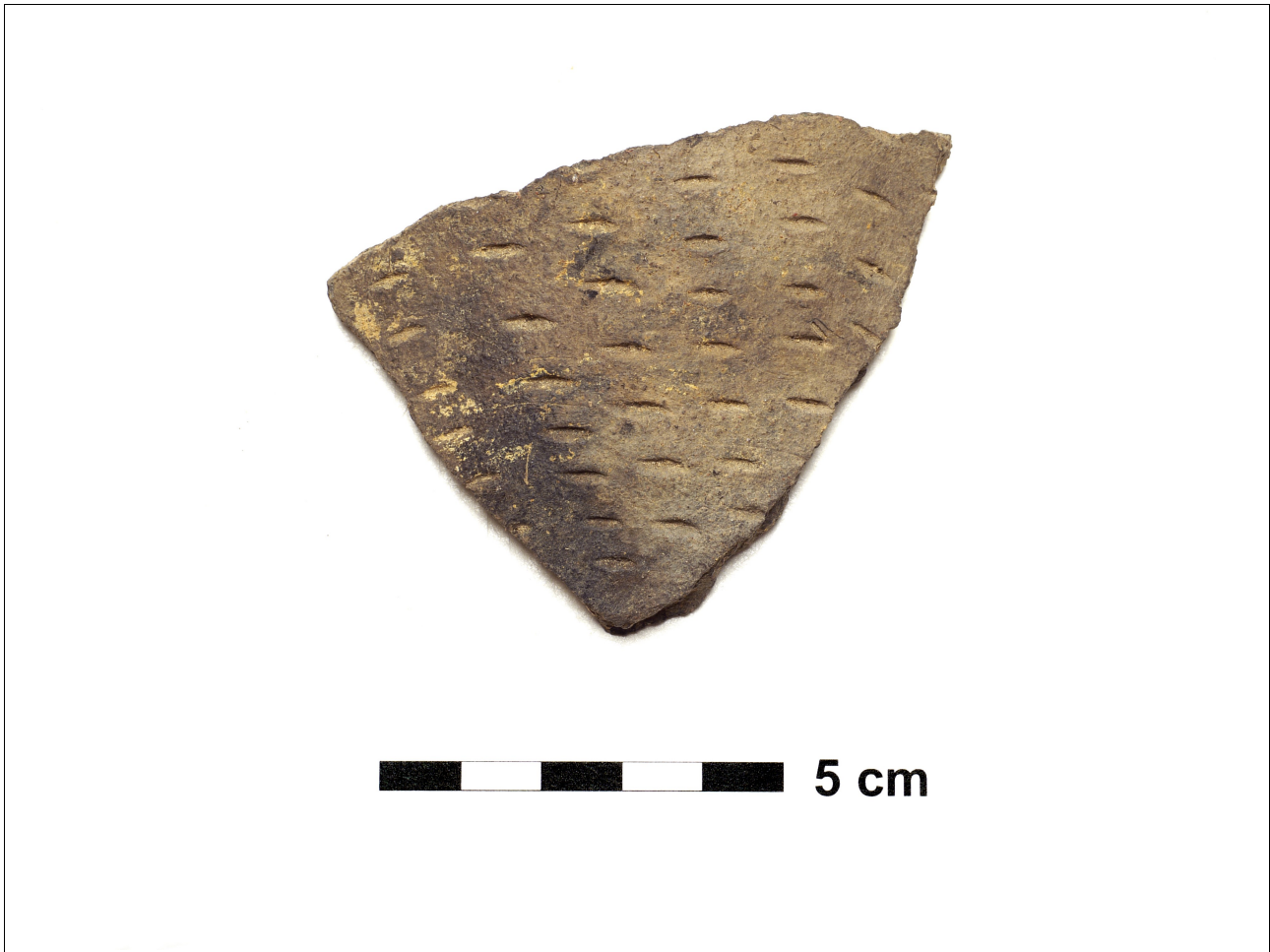
Figuur 8.1.5.12. Eelde, Groote Veen. Vondstnummer 4461/1037: RheinWeserGermaans met nagel-indrukken, vroeg tot midden romeinse tijd.