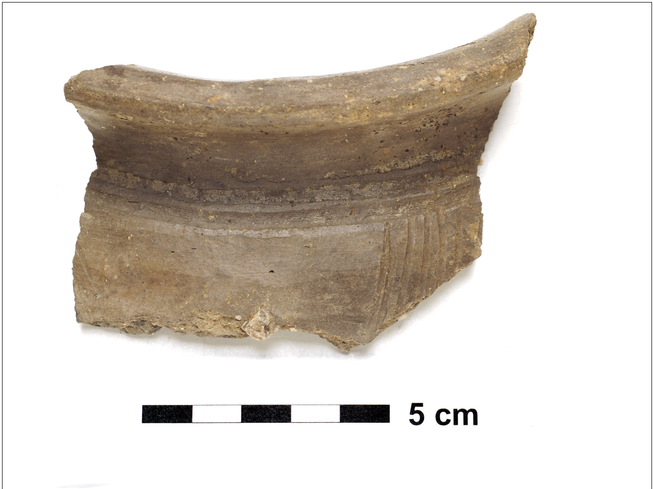
Figuur 8.1.5.2. Eelde, Grote Veen. Vondstnummer 4524/1032, type Gw5, vroeg romeinse tijd. Een randscherf met versiering in de vorm van streepband en diagonale strepen op de schouder.