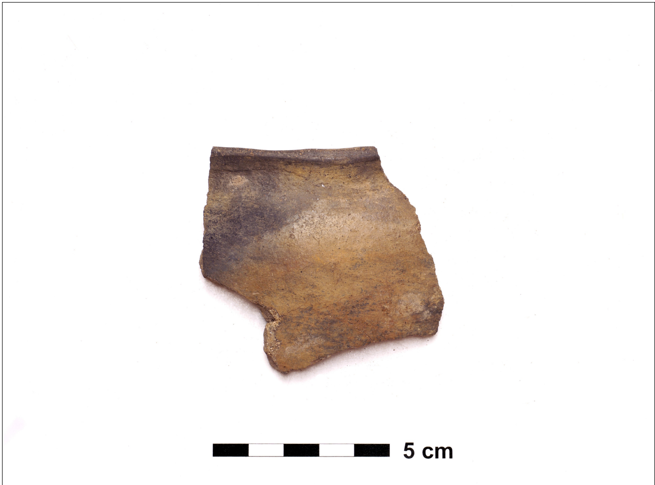
Figuur 8.1.5.5. Eelde, Groote Veen. Vondstnummer 4590/1019: type K2, vroeg romeinse tijd (chrono-groep 10).