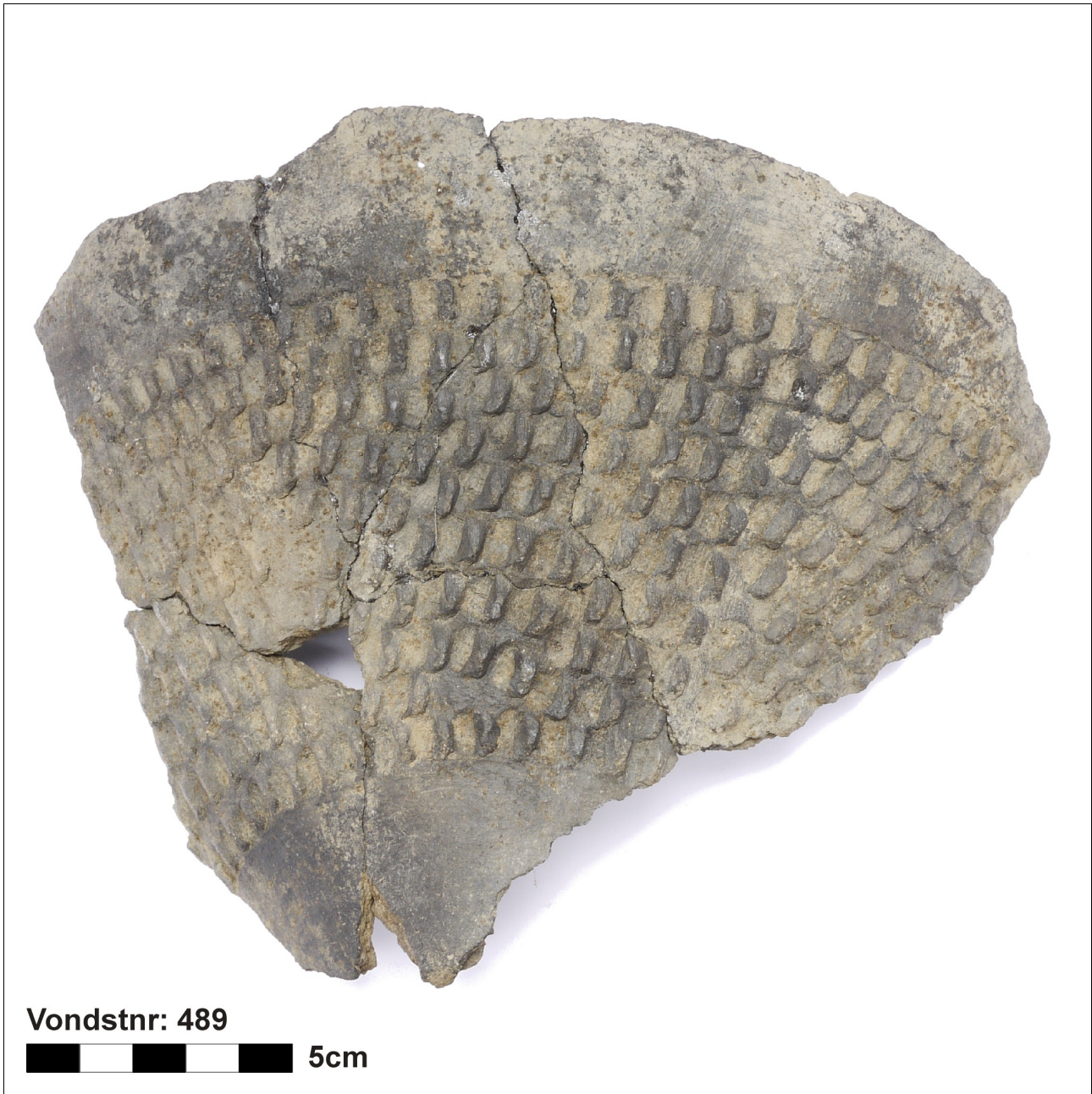
Figuur 8.1.5.41 Eelde, Groote Veen. Vondstnummer 498/1690: type K3 of K4, midden tot laat romeinse tijd. De pot is gedecoreerd met wartzen (chrono-groep 13).