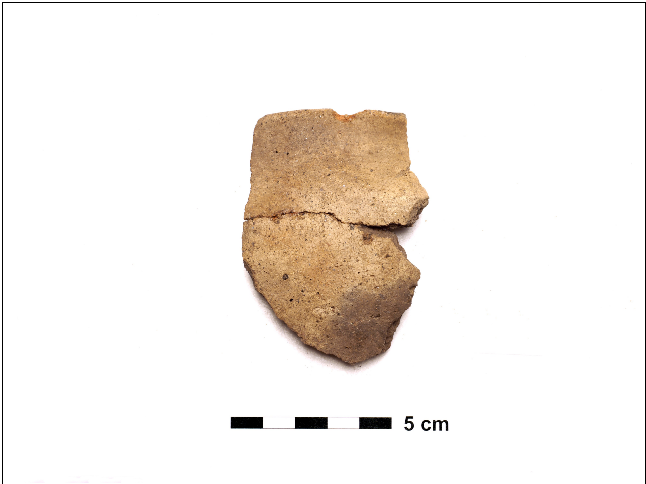
Figuur 8.1.5.16. Eelde, Groote Veen. Vondstnummer 833/1486: type Gw6a, midden romeinse tijd (chrono-groep 9).