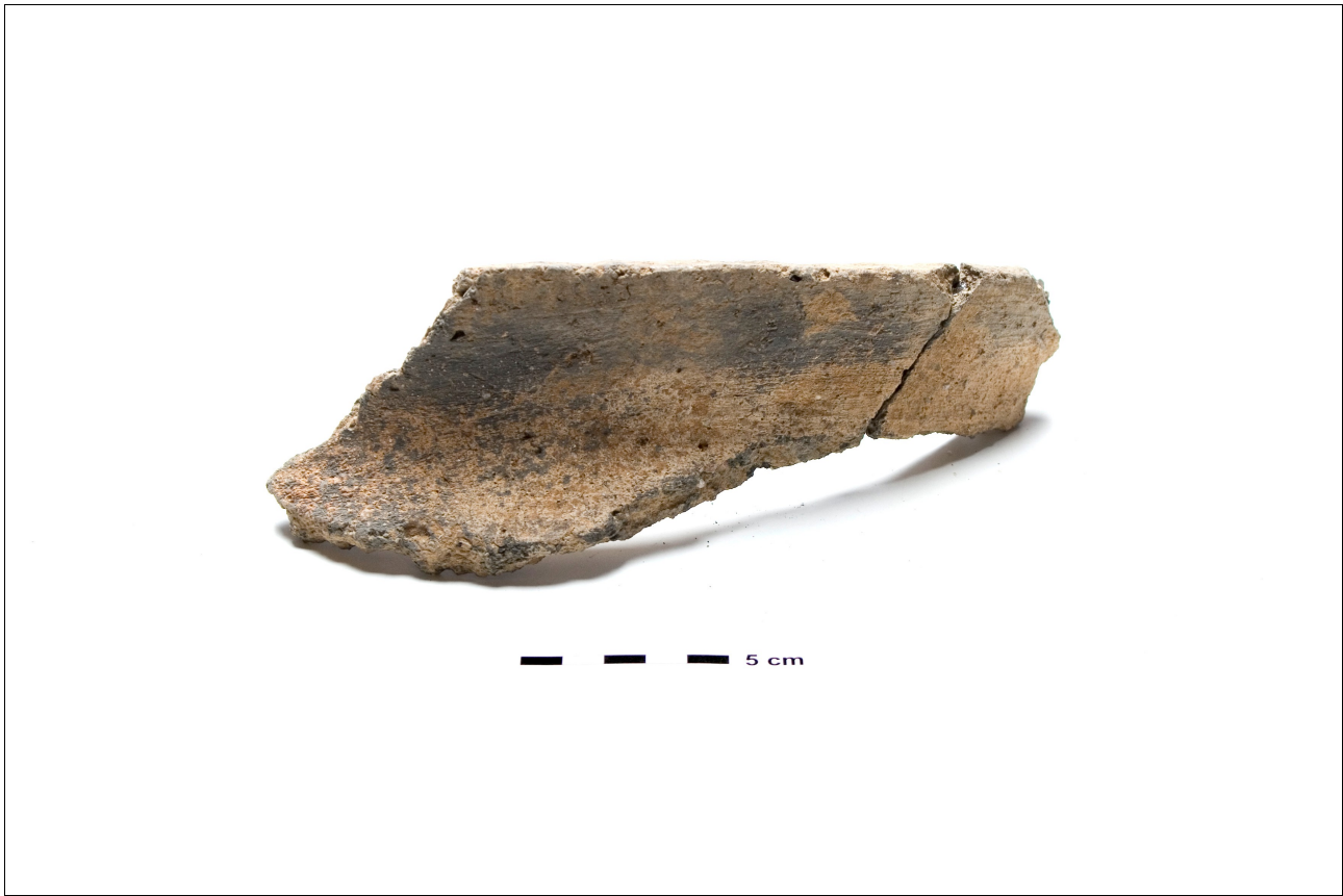
Figuur 8.1.5.32. Eelde, Groote Veen. Vondstnummer 198/1707: type Gw6?, midden tot laat romeinse tijd.