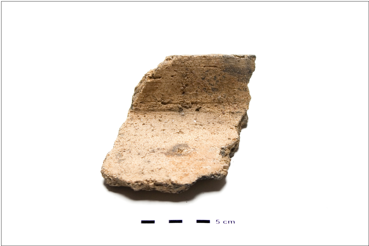
Figuur 8.1.5.33. Eelde, Groote Veen. Vondstnummer 198/1707: type Gw6?, midden tot laat romeinse tijd.