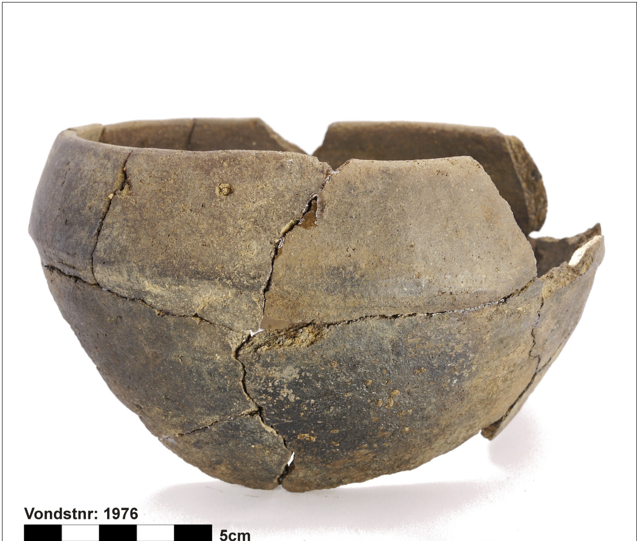
Figuur 8.1.5.7. Eelde, Grootte Veen. Vondstnummer 1976/131: RheinWeserGermaans aardewerk, type Ede B1, vroeg romeinse tijd (chrono-groep 11).