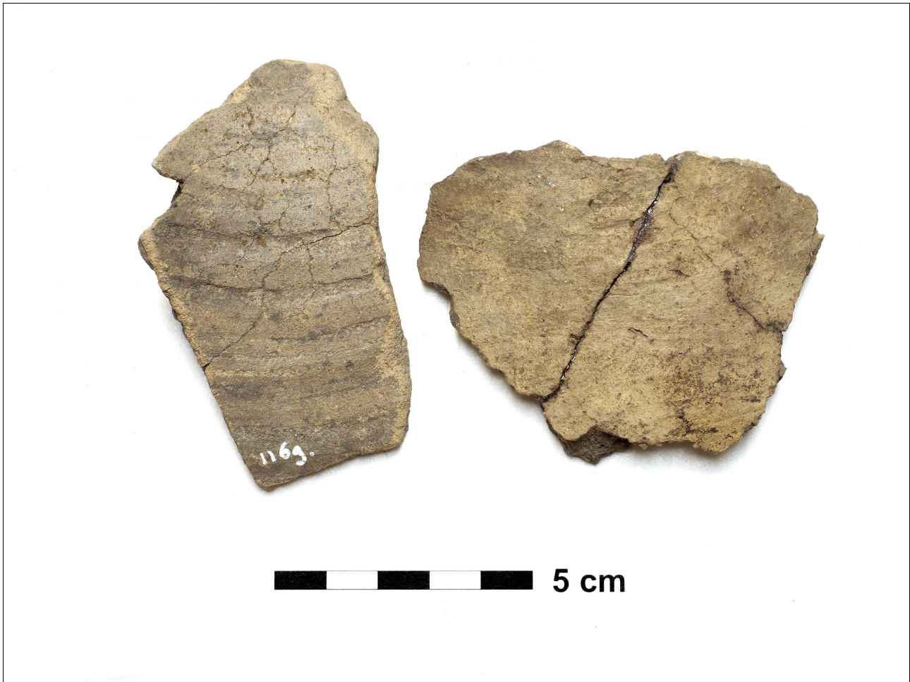
Figuur 8.1.5.46. Eelde, Groote Veen. Vondstnummer 1169/1655: scherven van een beker uit de midden tot laat romeinse tijd.