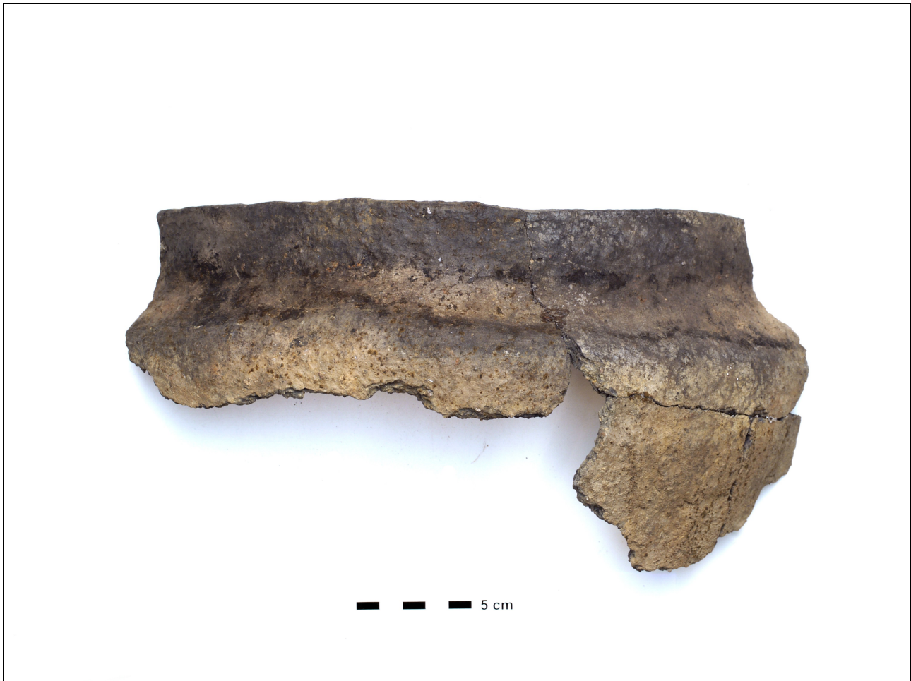
Figuur 8.1.5.37. Eelde, Groote Veen. Vondstnummer 498/1689: type Gw6b/c, midden tot laat romeinse tijd (chrono-groep 13).