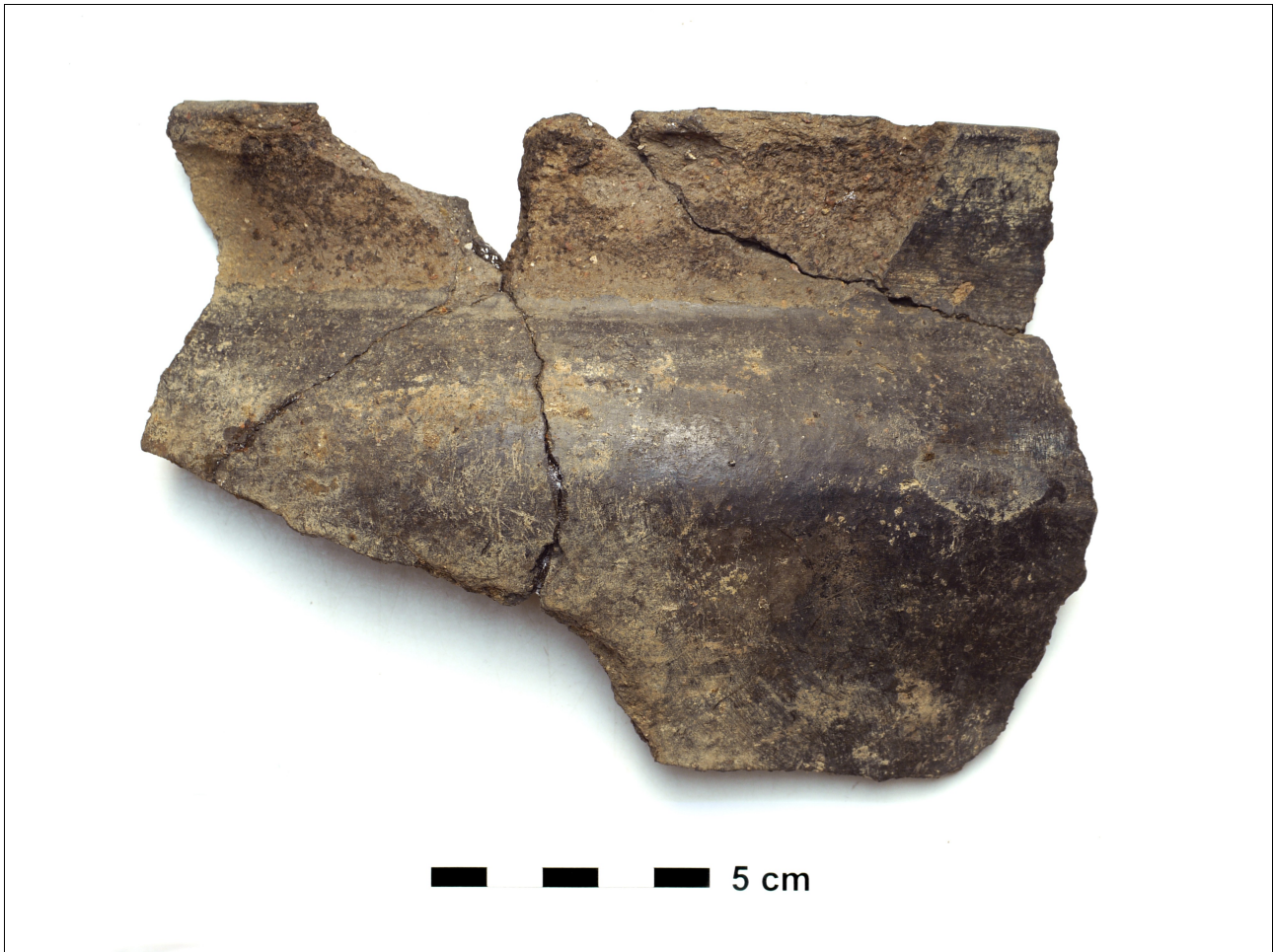
Figuur 8.1.5.18. Eelde, Groote Veen. Vondstnummer 340/1685: type Gw6b, midden romeinse tijd (chrono-groep 12).