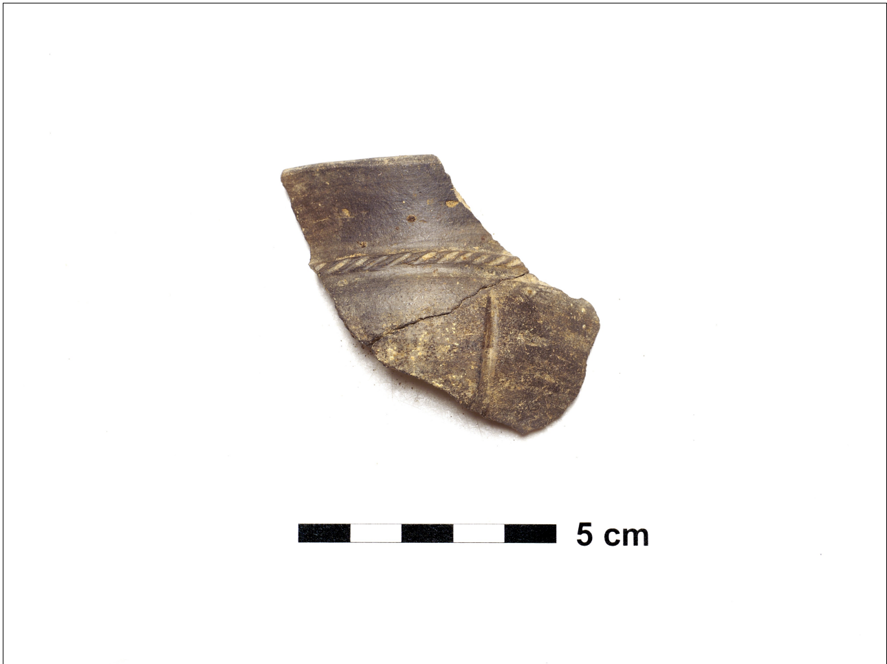
Figuur 8.1.5.51. Eelde, Groote Veen. Vondstnummer 5617/1114: type K4d, laat romeinse tijd. De pot is versierd met een rib met diagonale keven en verder met verticale groeven.