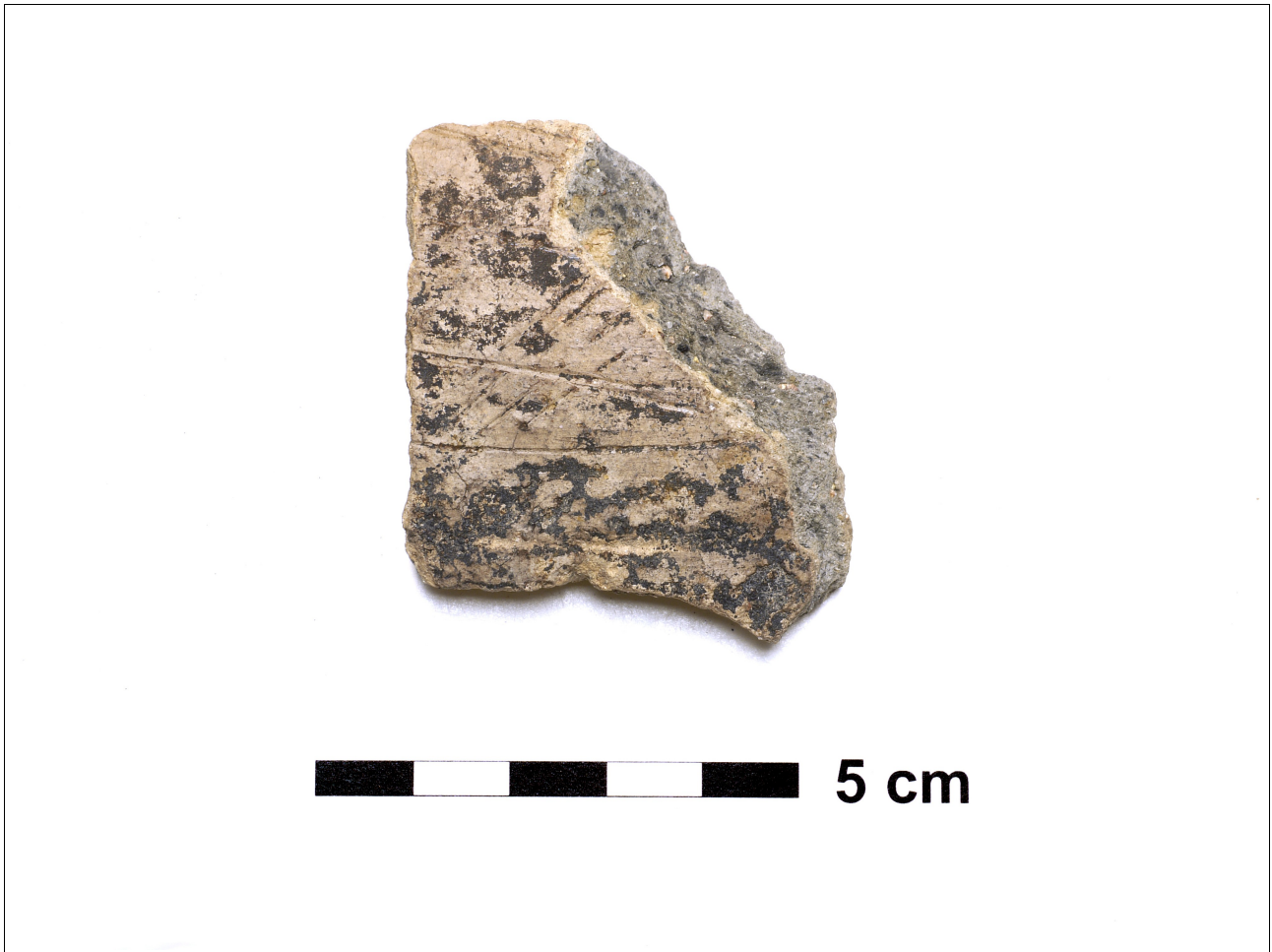
Figuur 8.1.4.3. Eelde, Grote Veen. Vondstnummer 5690/1285, scherf type G1/G2/G3, midden ijertijd. Versiering bestaat uit ingekaste lijnen.