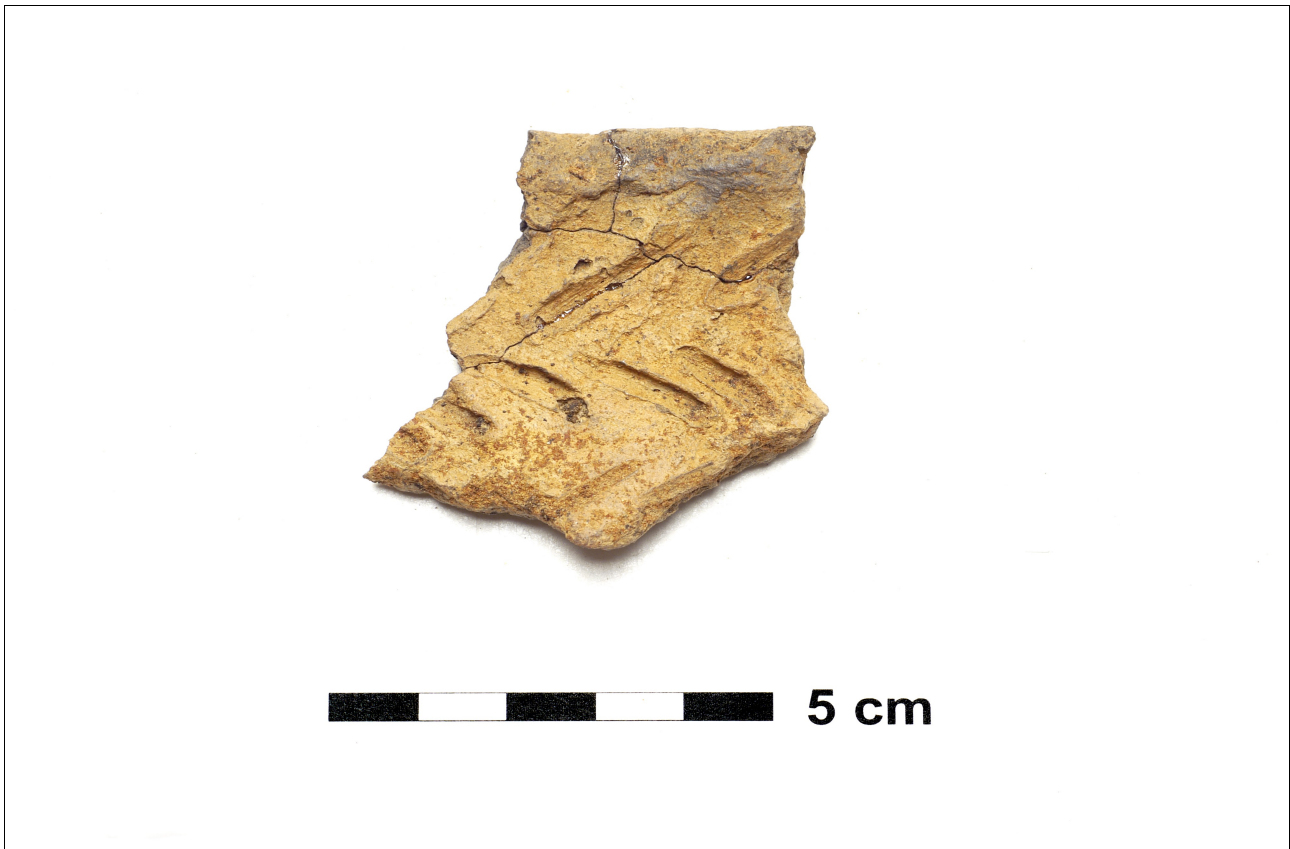
Figuur 8.1.2.1. Eelde, Groote Veen. Vondstnummer 3/1577: scherv van een laat-neolithische standvoetbeker met visgraatmotief.