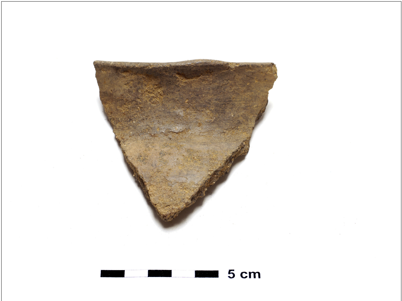
Figuur 8.1.4.5. Eelde, Grote Veen. Vondstnummer 2911/469, randscherf type G3, midden ijertijd (chrono-groep 4).