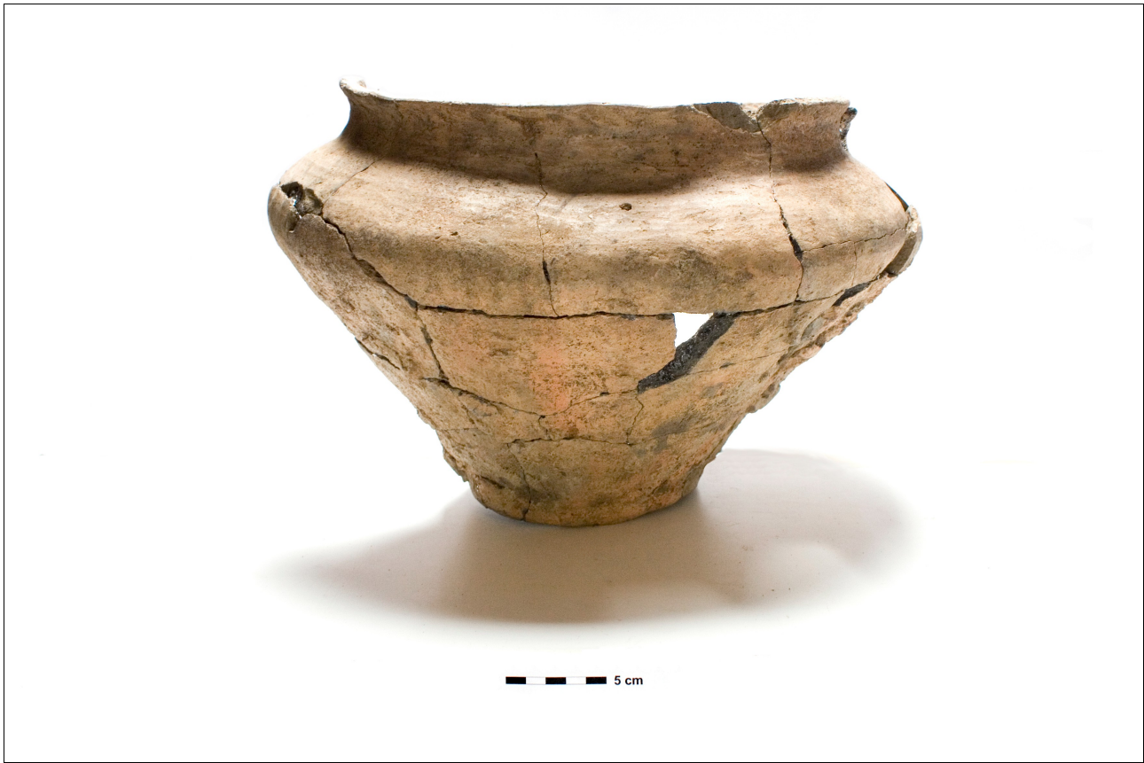
Figuur 8.1.4.10. Eelde, Groote Veen. Vondstnummer 583/1726, type Gw4?, late ijzertijd (chrono-groep 11). De pot is grotendeels besmeten.