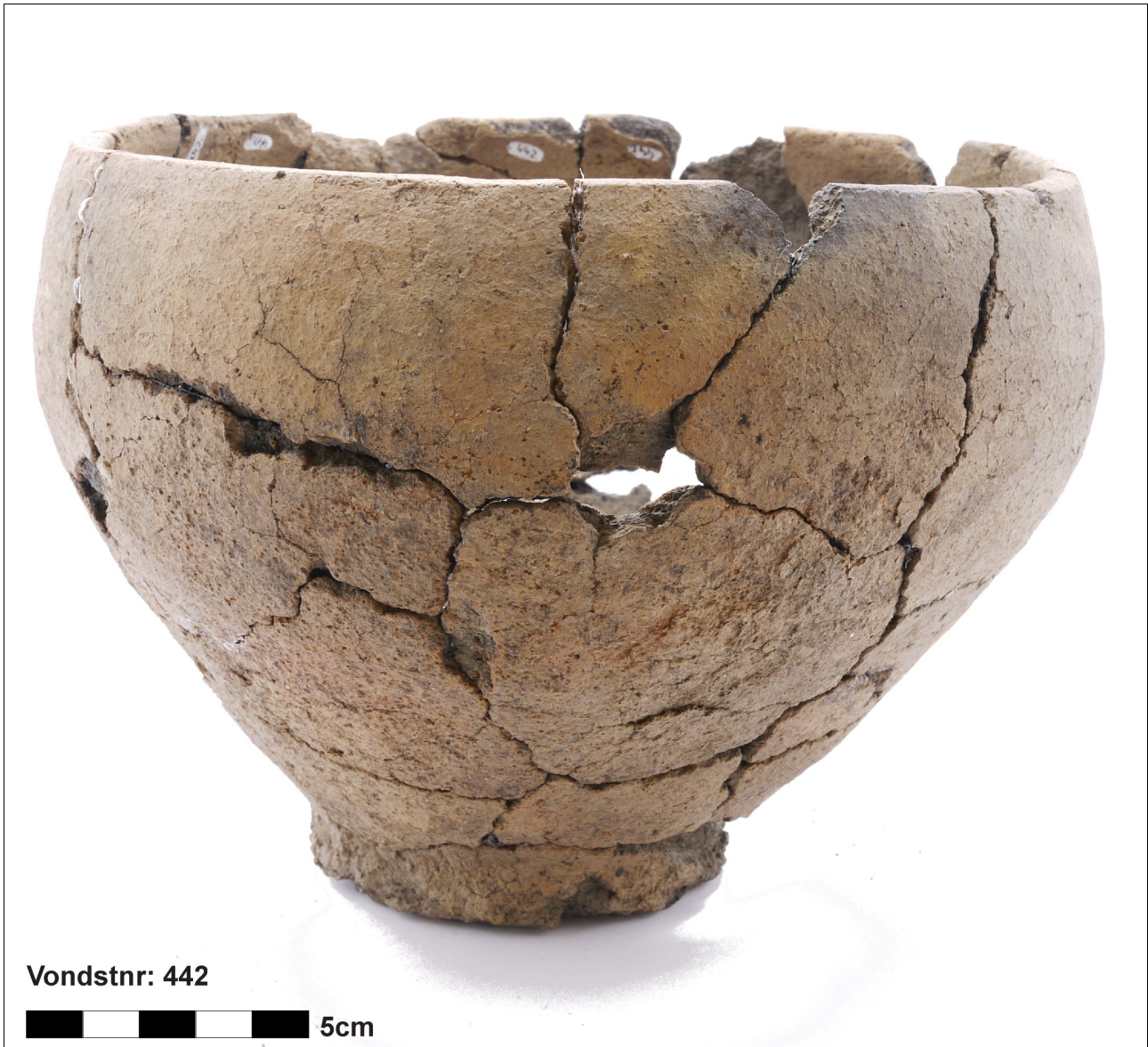
Figuur 8.1.5.31. Eelde, Groote Veen. Vondstnummer 442/1697: type S5, midden tot laat romeinse tijd (chronogroep 10).