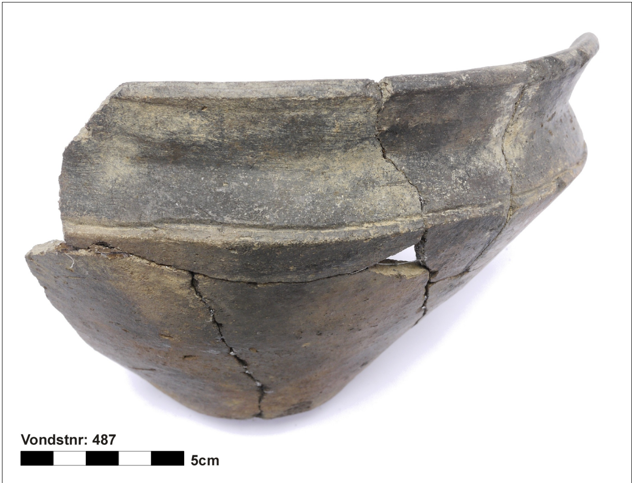
Figuur 8.1.5.27. Eelde, Groote Veen. Vondstnummer 487/1710: type K3a met een horizontale groef, midden romeinse tijd.