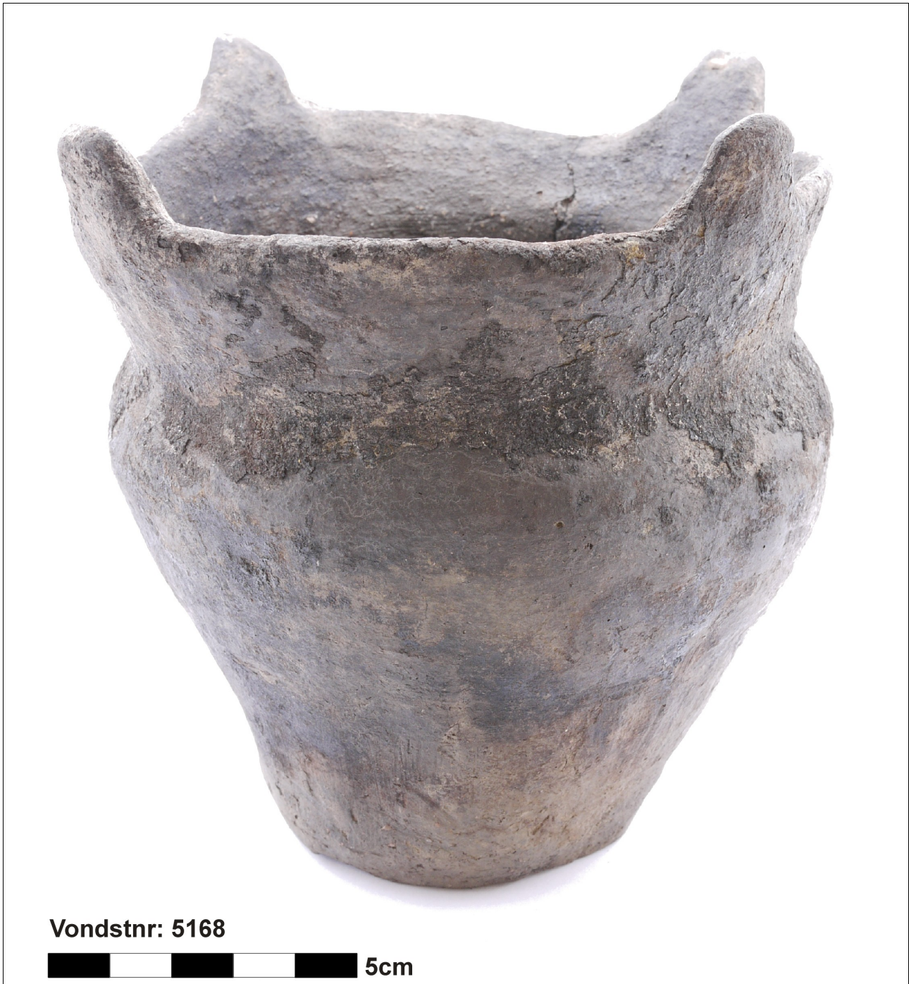
Figuur 8.1.5.29. Eelde, Grote Veen. Vondstnummer 5168/?, niet aan een type toe te wijzen. De pot is uit de tweede eeuw nC en heeft uitgetrokken oren.