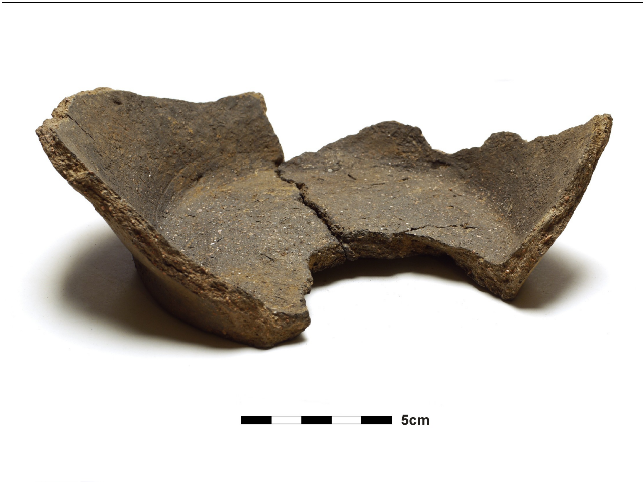
Figuur 8.1.4.9. Eelde, Grootte Veen. Vondstnummer 3490/821, bodem, geen type. De rest van het vondstnummer dateert uit de vroege tot midden ijertijd (chrono-groep 3), maar de brede bodem doet later aan.