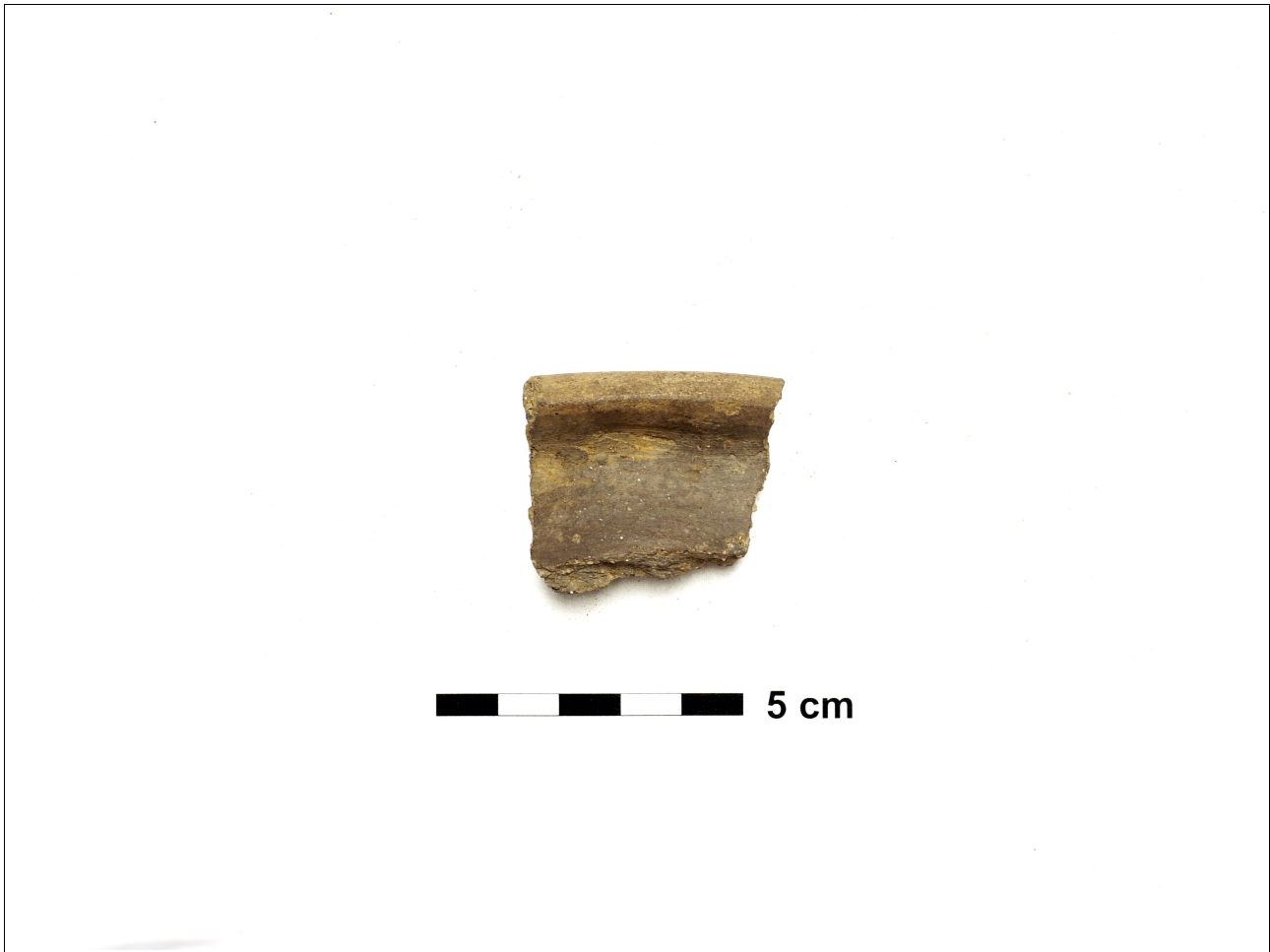
Figuur 8.1.5.10. Eelde, Groote Veen. Vondstnummer 800/1482: RheinWeserGermaans, type Gw5/Ede B2, vroeg tot midden romeinse tijd (chrono-groep 11).