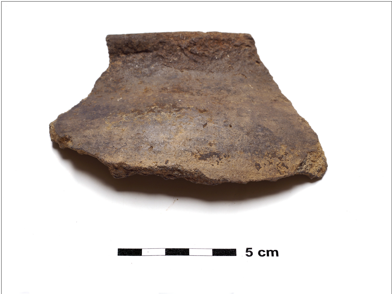
Figuur 8.1.4.2. Eelde, Grote Veen. Vondstnummer 3490/?, randscherf type G3, vroege tot midden ijzertijd (chrono-groep 3).