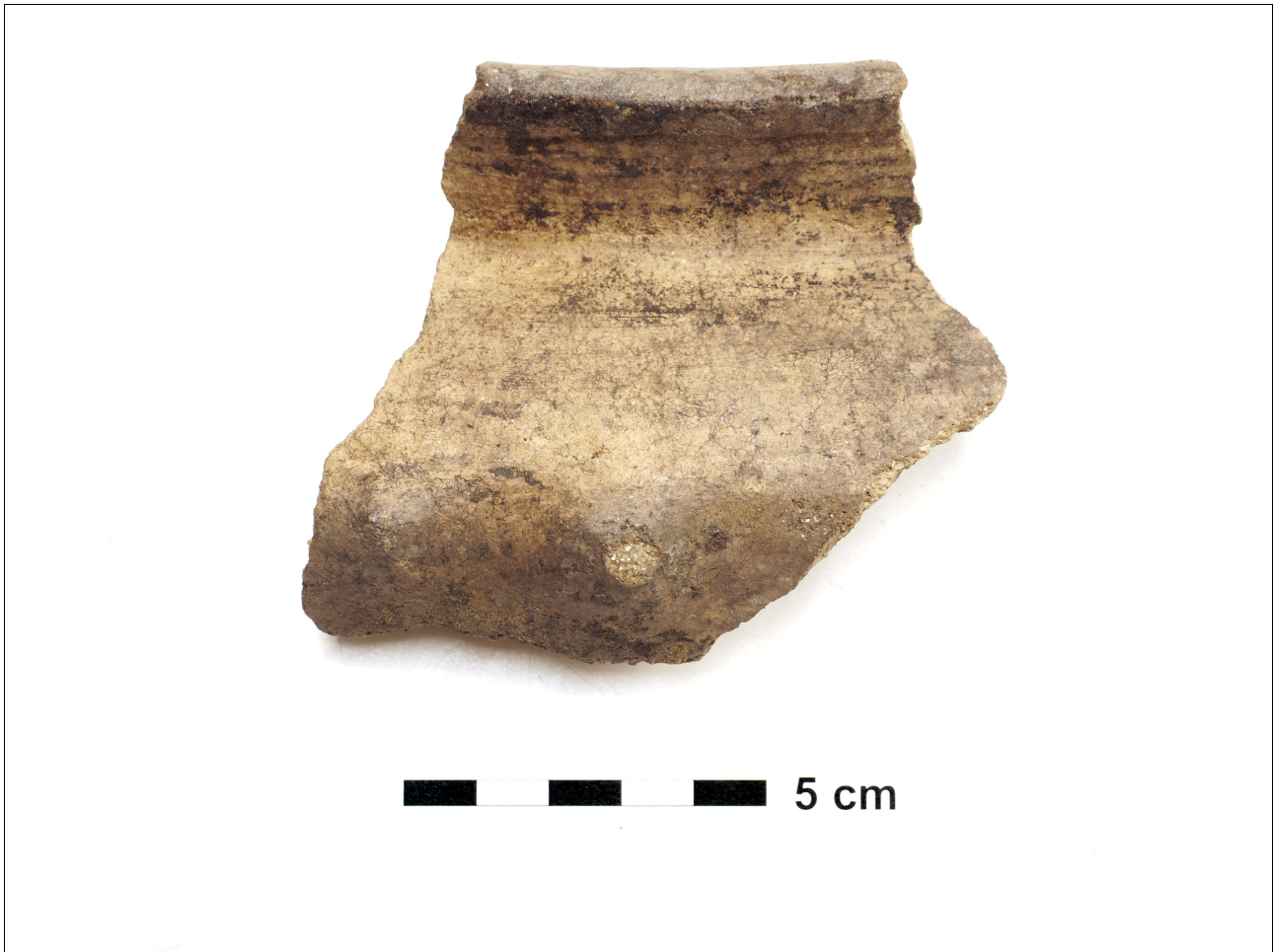
Figuur 8.1.5.15. Eelde, Groote Veen. Vondstnummer 5263/1093: RheinWeserGermaans, type Gw6a, midden romeinse tijd. Op het breedste deel van de pot zijn twee puisten zichtbaar.