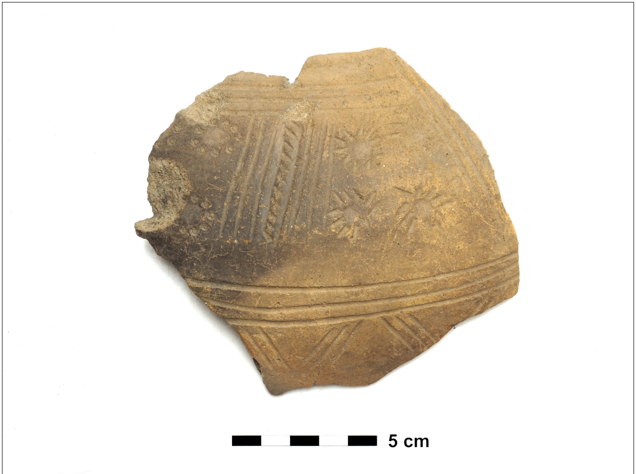
Figuur 8.1.8.1. Eelde, Grote Veen. Vondstnummer 3140/583: Angelsaksisch aardewerk met versiering van ingekraste strepen, bloemen en sterren, tussen 450 en 550 nC.