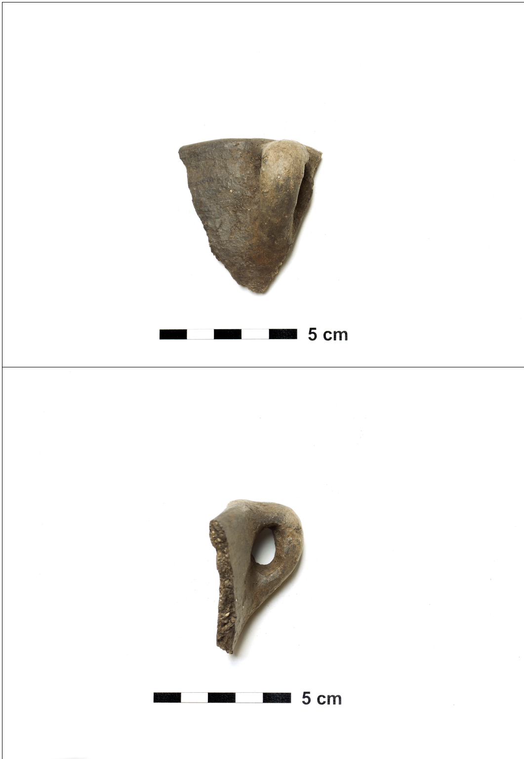
Figuur 8.1.5.52. Eelde, Grote Veen. Vondstnummer 1311/1553: type S4, laat romeins met een verticaal worstoor.