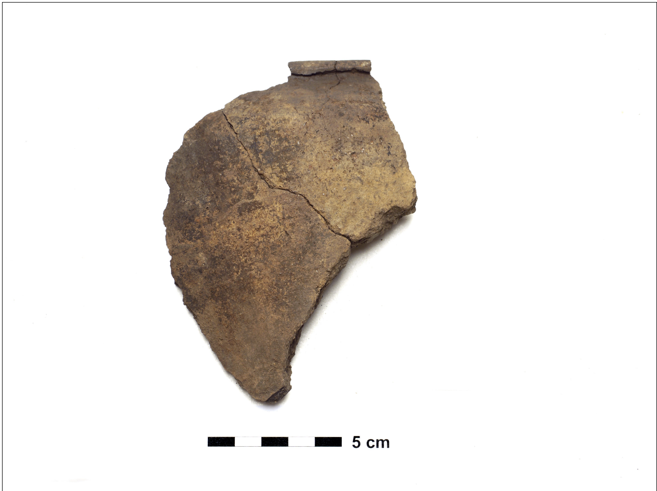
Figuur 8.1.5.9. Eelde, Groote Veen. Vondstnummer 1156/1652: RheinWeserGermaans, type Ede A2, vroeg tot midden romeinse tijd.