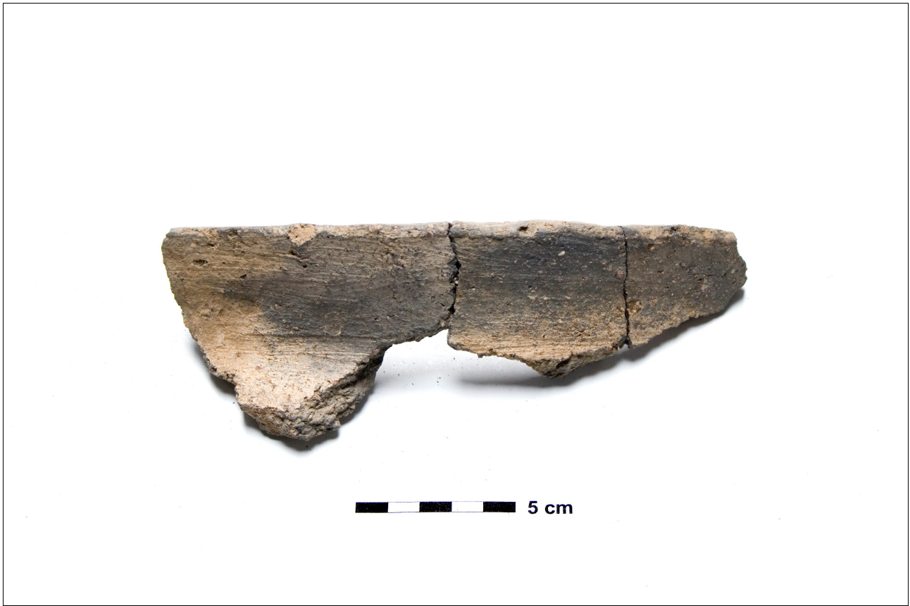
Figuur 8.1.5.19. Eelde, Groote Veen. Vondstnummer 198/1707: type Gw6?, midden romeinse tijd.