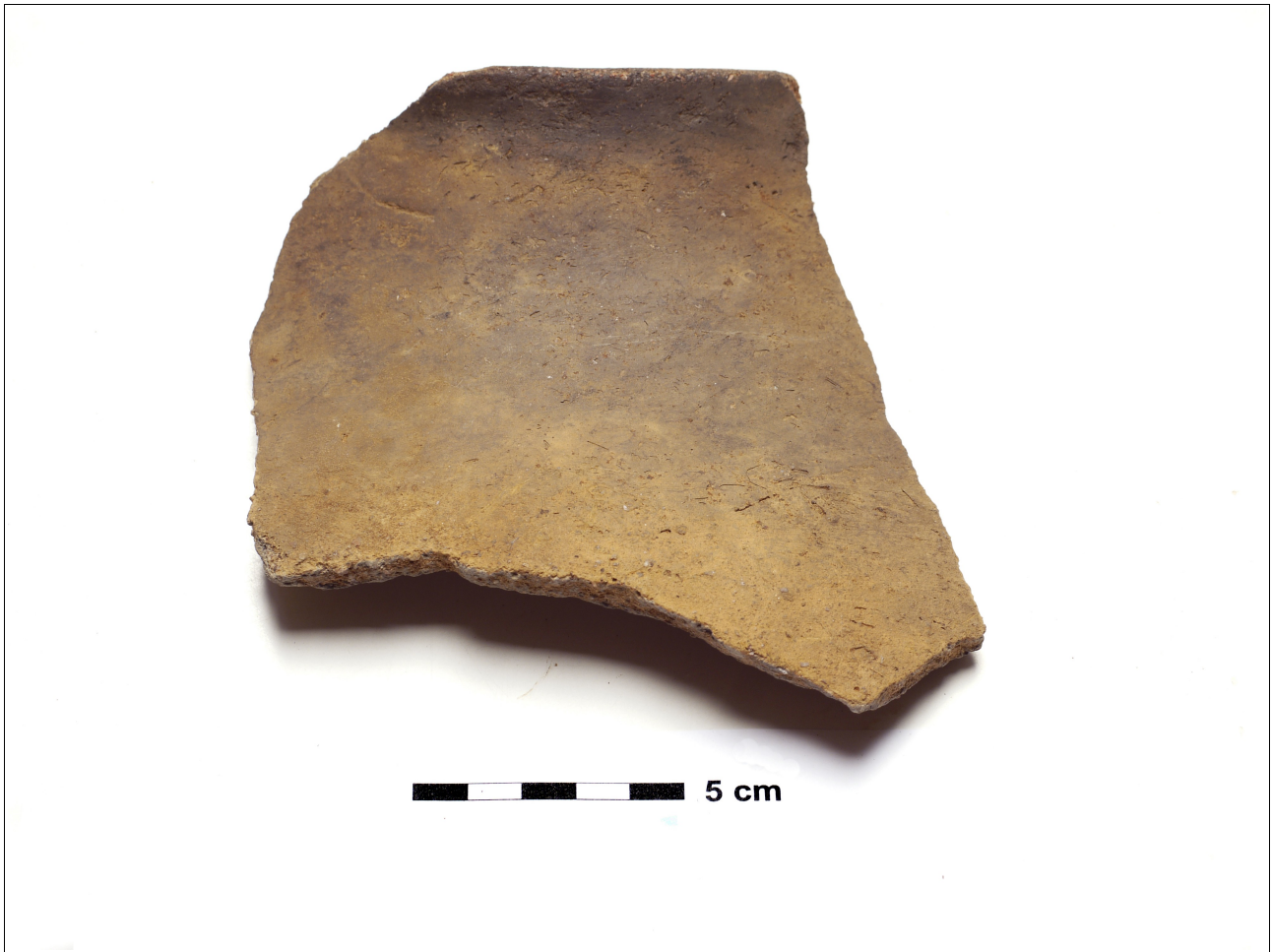
Figuur 8.1.4.1. Eelde, Grote Veen. Vondstnummer 3490/816, randscherf type G0/G1, midden ijzertijd (chronogroep 3).