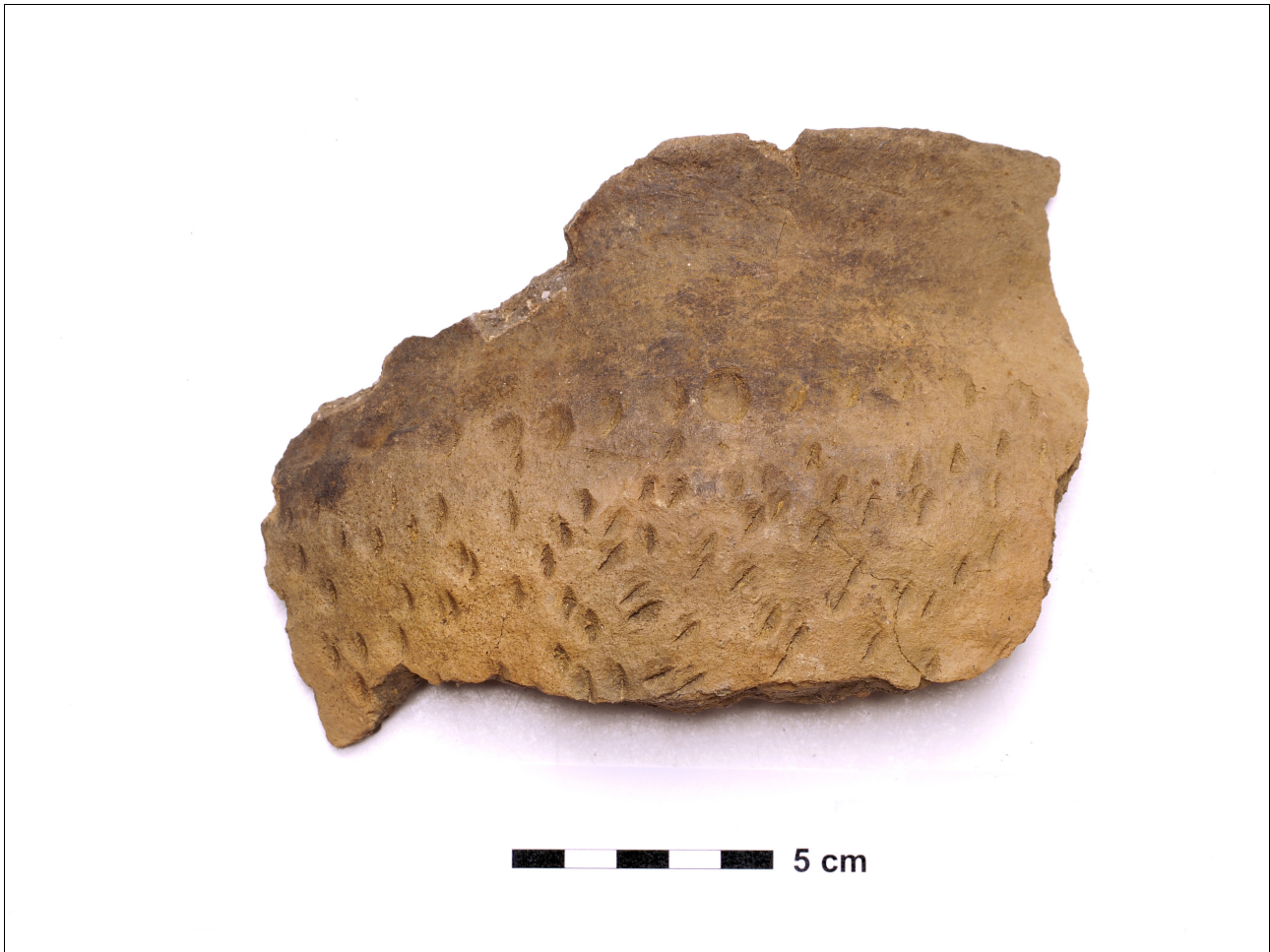
Figuur 8.1.4.6. Eelde, Grote Veen. Vondstnummer 2888/449, randscherf type V2, vroege tot midden ijzertijd (chrono-groep 4). Versiering bestaat uit vingerindrukken op de rand en nagelindrukken op de wand.