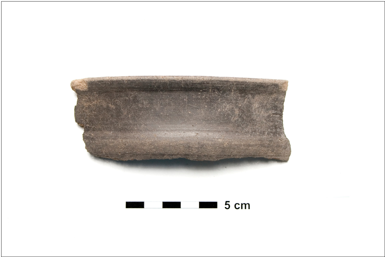
Figuur 8.1.7.3. Eelde, Groote Veen. Vondstnummer 3291/677: rand van terra nigra -achtig aardewerk uit de laat romeinse tijd, type K4b.