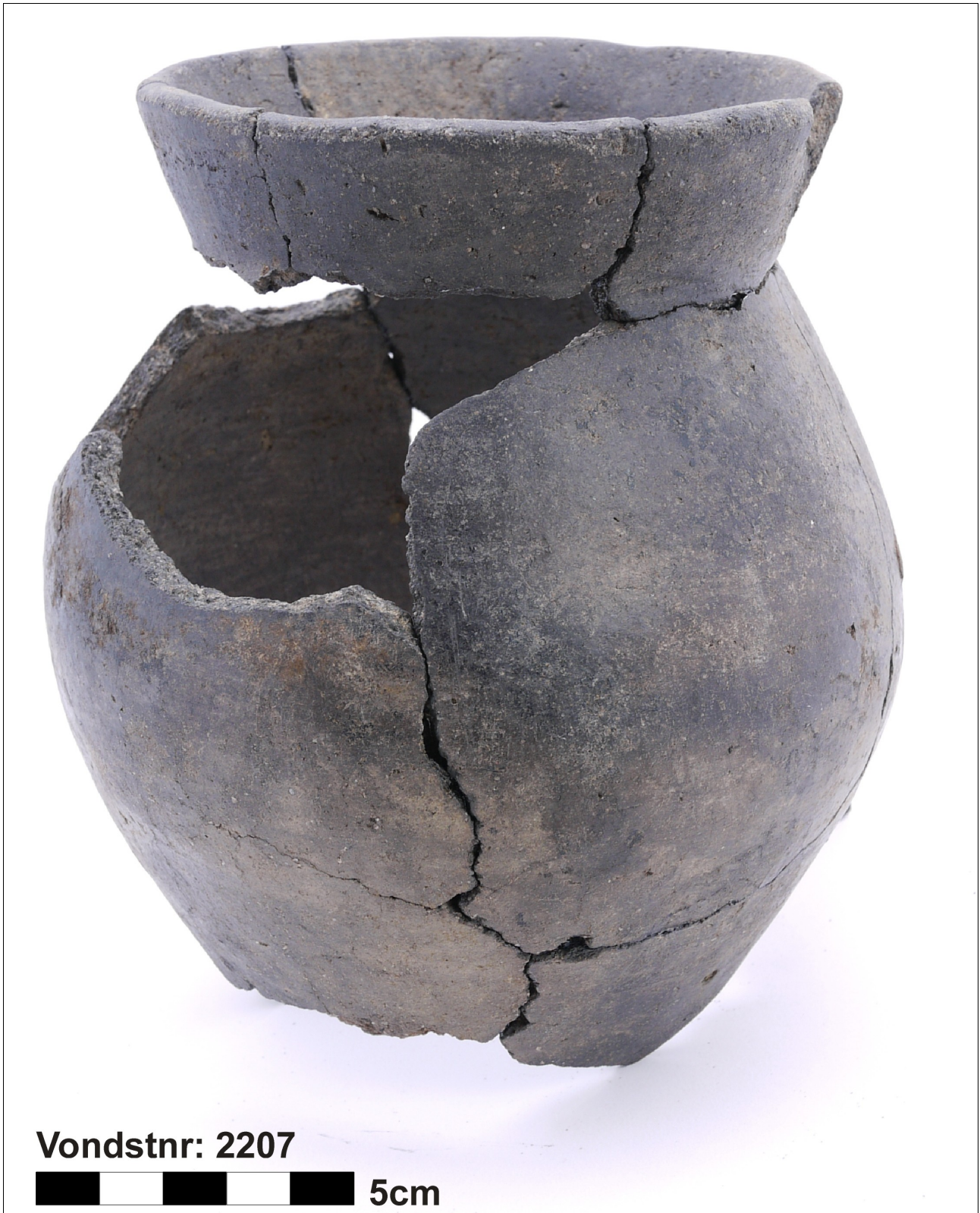
Figuur 8.1.5.38. Eelde, Groote Veen. Vondstnummer 2207/135: type Ge6, midden tot laat romeinse tijd.