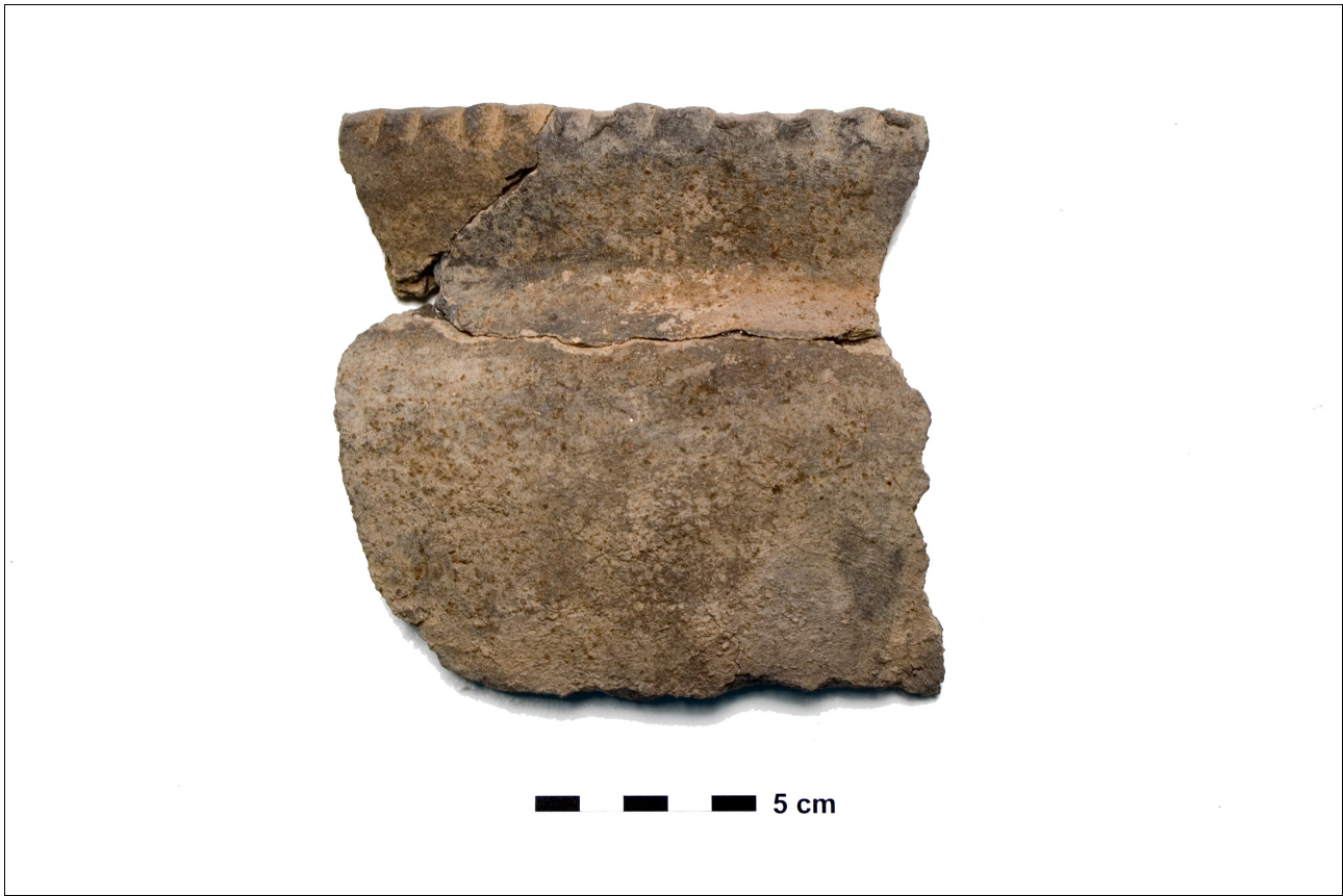
Figuur 8.1.5.20. Eelde, Groote Veen. Vondstnummer 567/1703: type V5, midden romeinse tijd. De pot is versierd met vinger-indrukken op de rand.