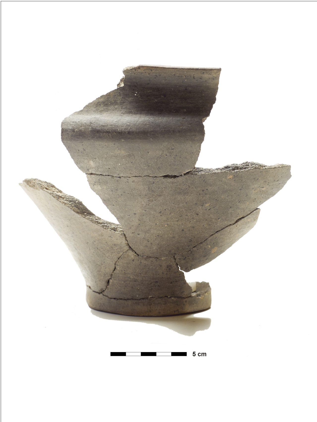
Figuur 8.1.5.48. Eelde, Groote Veen. Vondstnummer 3260/694: type G7d, laat romeinse tijd (chrono-groep 13).