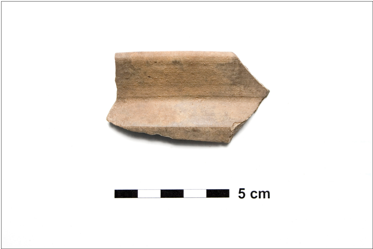
Figuur 8.1.5.25. Eelde, Groote Veen. Vondstnummer 3291/679: type K3a, import aardewerk uit de midden romeinse tijd.