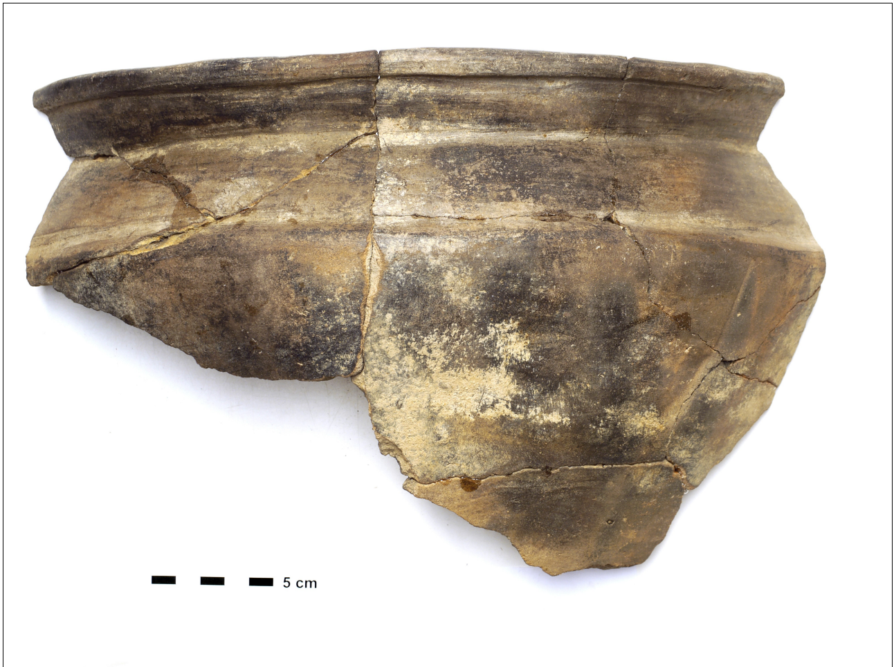
Figuur 8.1.5.36. Eelde, Groote Veen. Vondstnummer 220/1660: type Gw6b, midden tot laat romeinse tijd. Deze pot heeft groeven op de schouders en een verdikte lip.