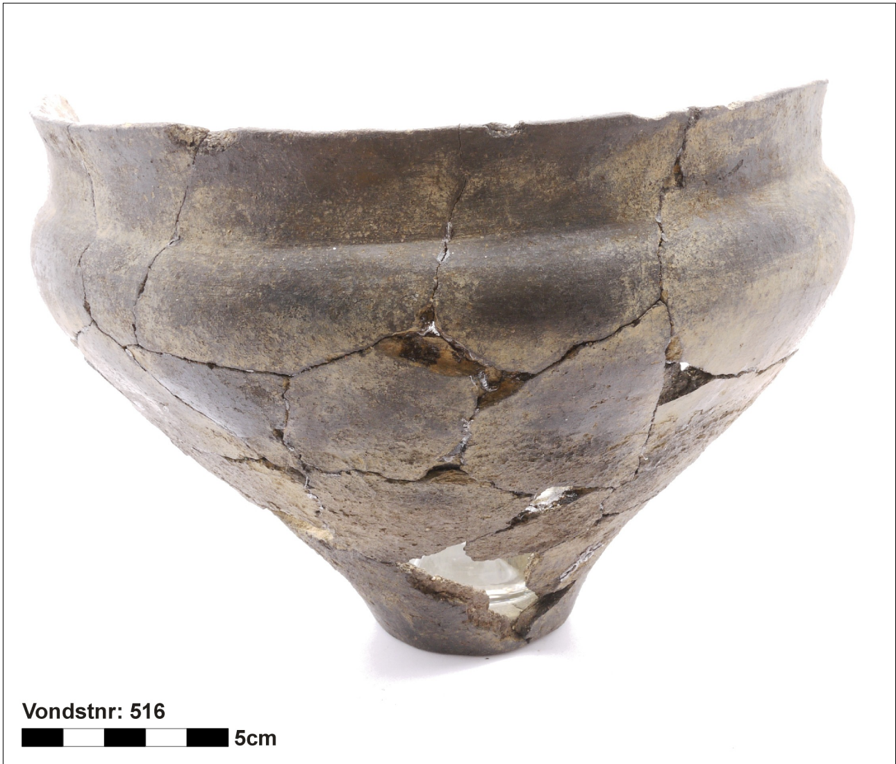
Figuur 8.1.5.50. Eelde, Groote Veen. Vondstnummer 516/1691: type K4d, laat romeinse tijd. De onderste helft van de pot is besmeten (chrono-groep 12).