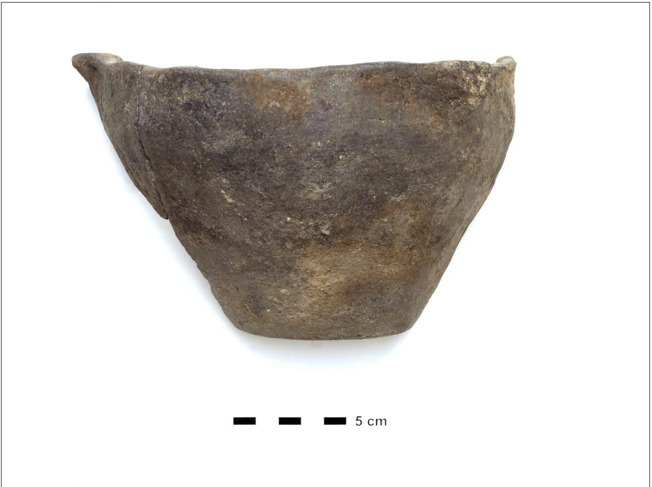
Figuur 8.1.8.2. Eelde, Grote Veen. Vondstnummer 3141/584: pot met twee knoporen, waarschijnlijk vroege middeleeuwen, mogelijk eerder.