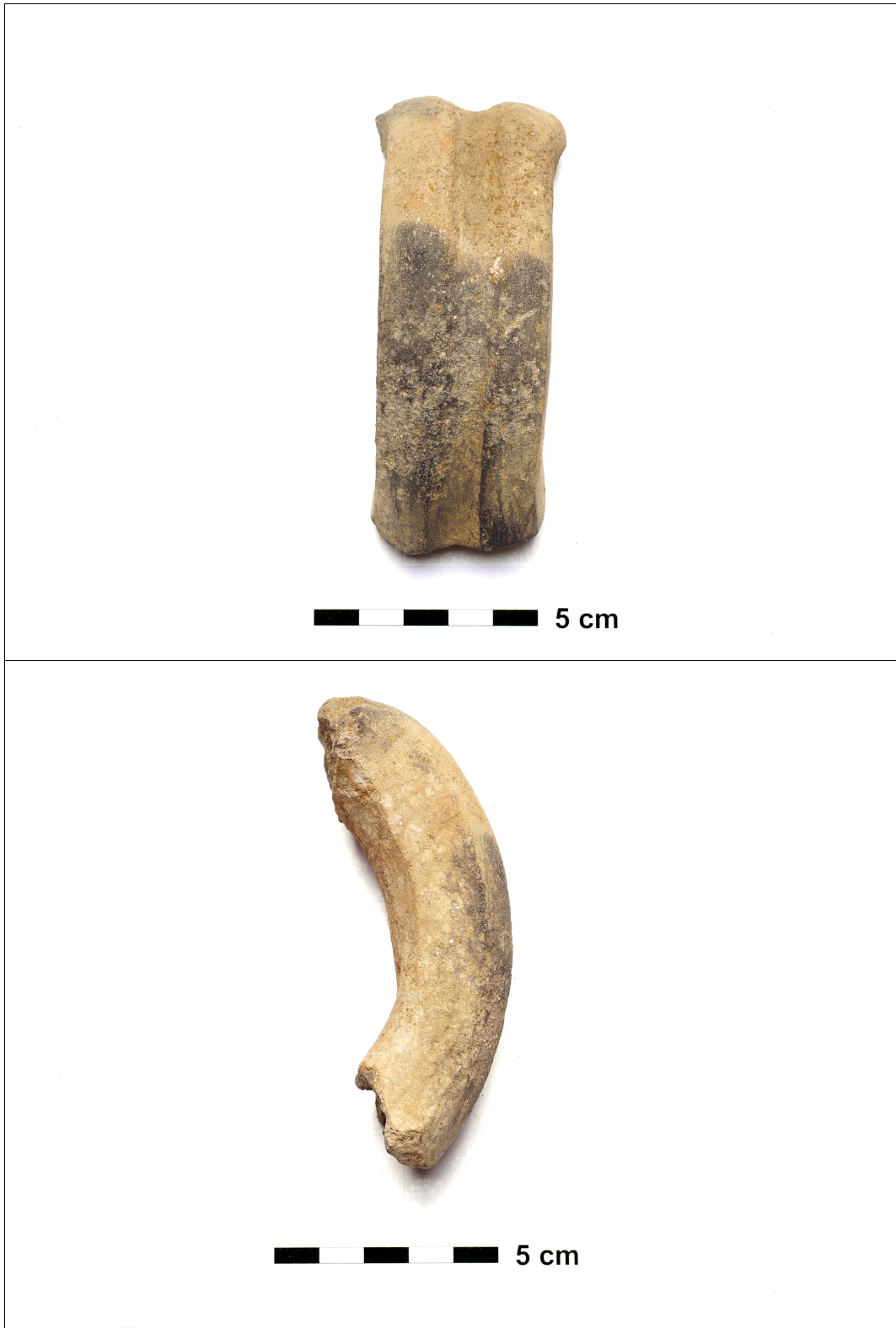
Figuur 8.1.5.56. Eelde, Grootte Veen. Vondstnummer 1595/1591: oor met verticale groef, mogelijk van amfoor? Romeinse tijd.