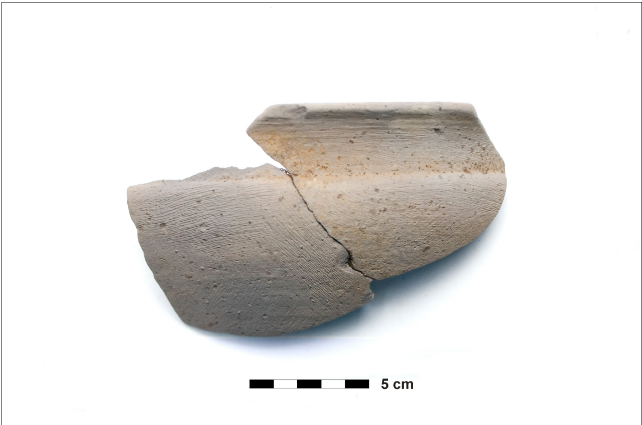
Figuur 8.1.7.1. Eelde, Grootte Veen. Vondstnummer 136/1537: rand van terra nigra -achtig aardewerk uit de midden tot laat romeinse tijd (type K4d), de strepen op de wand zijn beschadigingen die tijdens het schoonmaken zijn veroorzaakt.