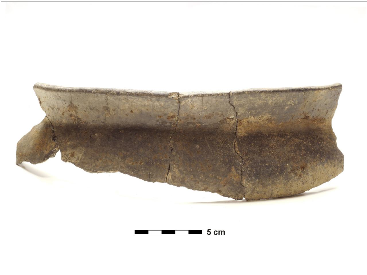
Figuur 8.1.5.1. Eelde, Groote Veen. Vondstnummer 340/1687, type G5, vroeg romeins (chrono-groep 12).