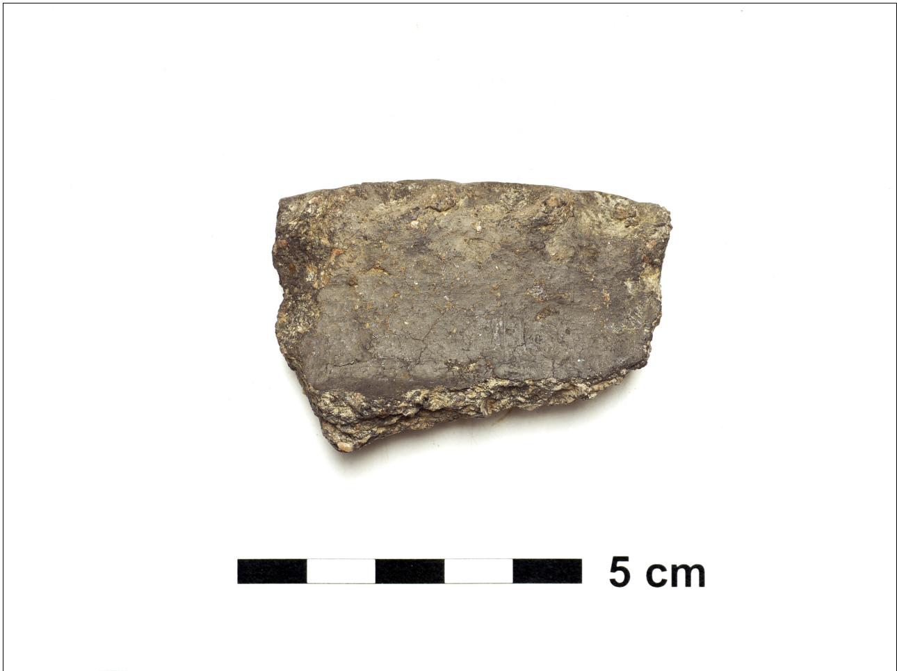
Figuur 8.1.5.24. Eelde, Groote Veen. Vondstnummer 1881/96: type V5 uit de midden romeinse tijd. De rand is een kartelrand met vinger-indrukken (chrono-groep 11).