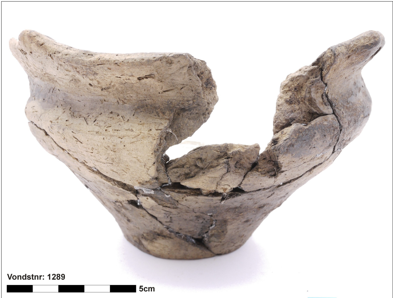
Figuur 8.1.5.26. Eelde, Groote Veen. Vondstnummer 1289/1721: type K3a mogelijk, midden romeinse tijd. Deze pot is organisch gemagerd, hetgeen in de tweede eeuw nC niet vaak meer voorkomt.