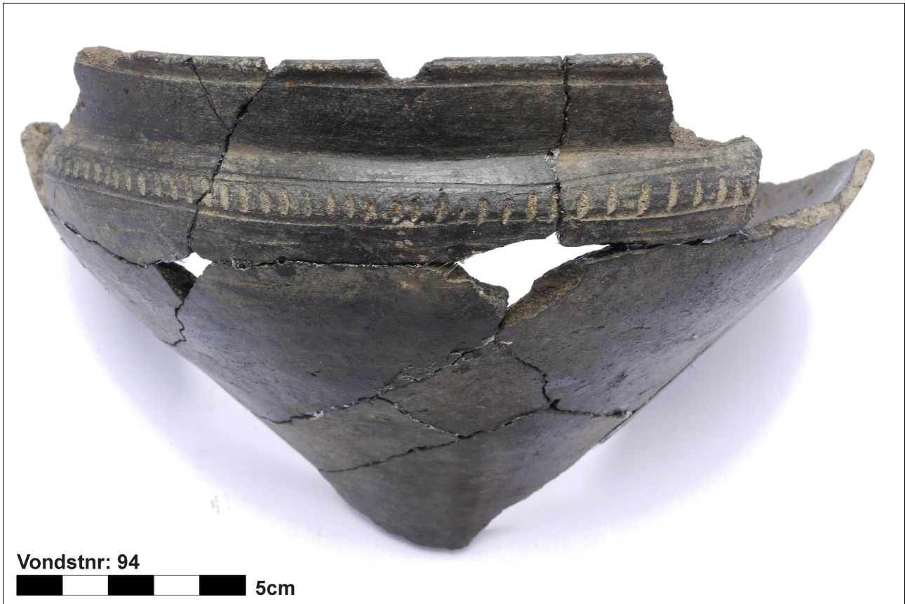
Figuur 8.1.5.49. Eelde, Groote Veen. Vondstnummer 94/1715: type K3c of K4b, laat romeinse tijd (chrono-groep 12).