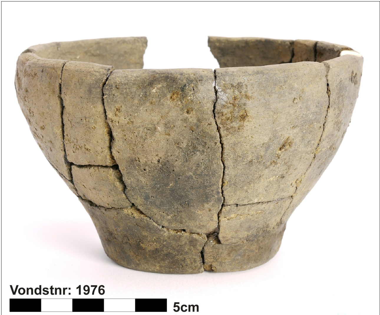
Figuur 8.1.5.8. Eelde, Grootte Veen. Vondstnummer 1976/130: mogelijk RheinWeserGermaans aardewerk, type S5, vroeg romeinse tijd (chrono-groep 11).