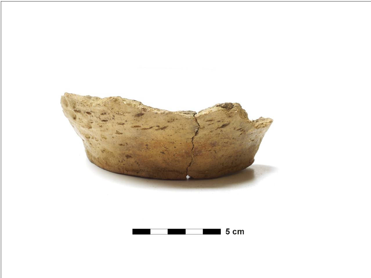
Figuur 8.1.4.8. Eelde, Groote Veen. Vondstnummer 2911/465, bodem, geen type, maar de rest van het vondstnummer is voornamelijk in de vroege tot midden ijertijd gedateerd (chrono-groep 4).