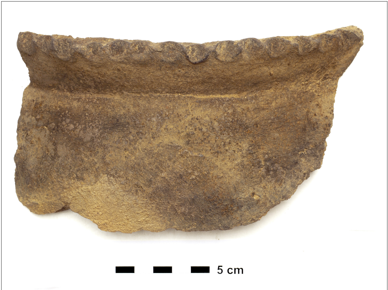
Figuur 8.1.5.22. Eelde, Groote Veen. Vondstnummer 583/?: type V5, midden romeinse tijd (chrono-groep 11). De rand is versierd met vinger-indrukken.