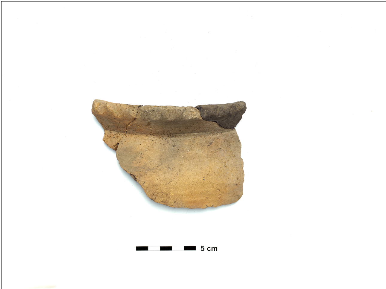
Figuur 8.1.5.40. Eelde, Groote Veen. Vondstnummer 498/1702: type V5, midden romeinse tijd. De pot heeft vinger-indrukken op de rand (chrono-groep 13).