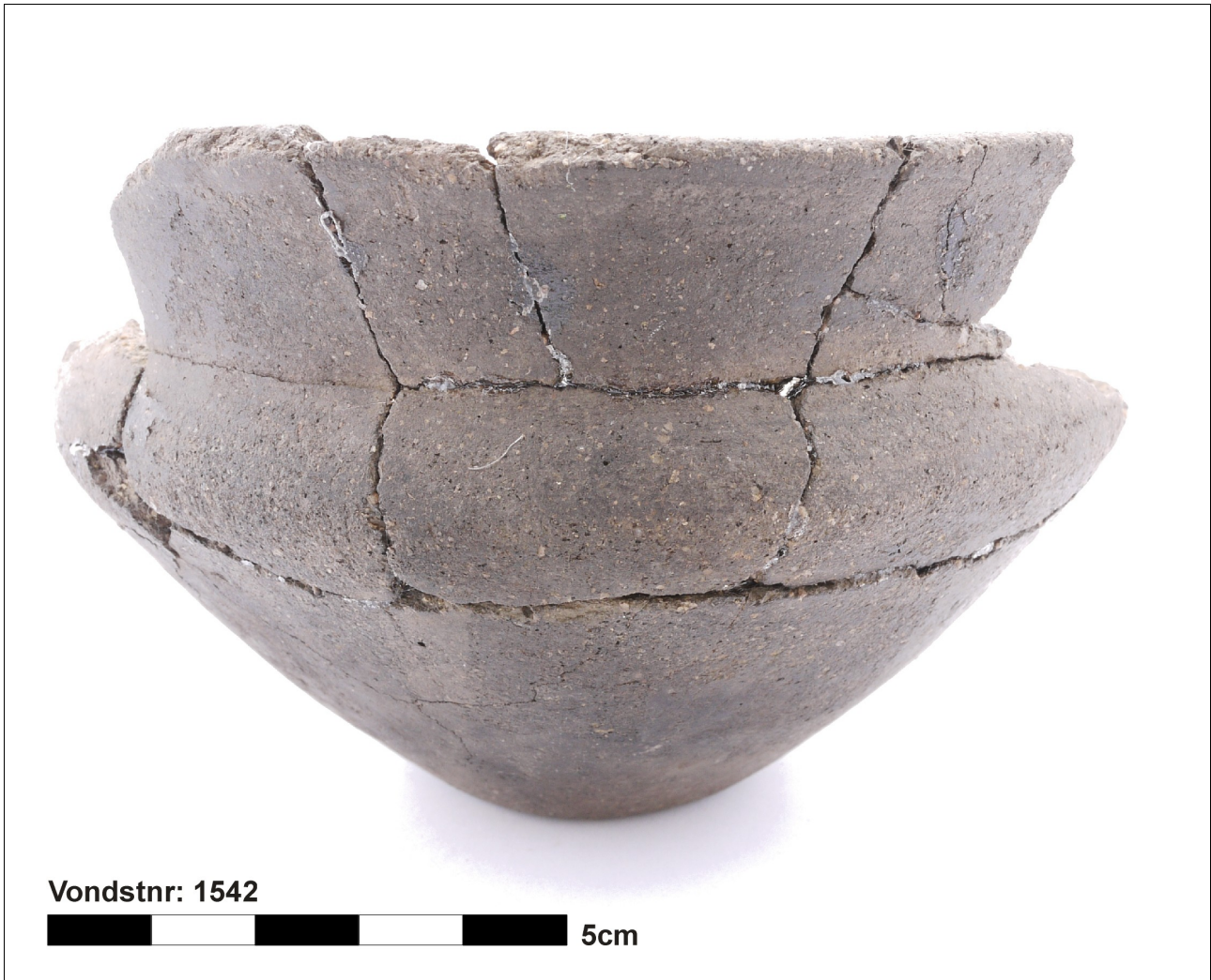
Figuur 8.1.5.43. Eelde, Groote Veen. Vondstnummer 1542/1720: type K4b, midden tot laat romeinse tijd (chronogroep 13).