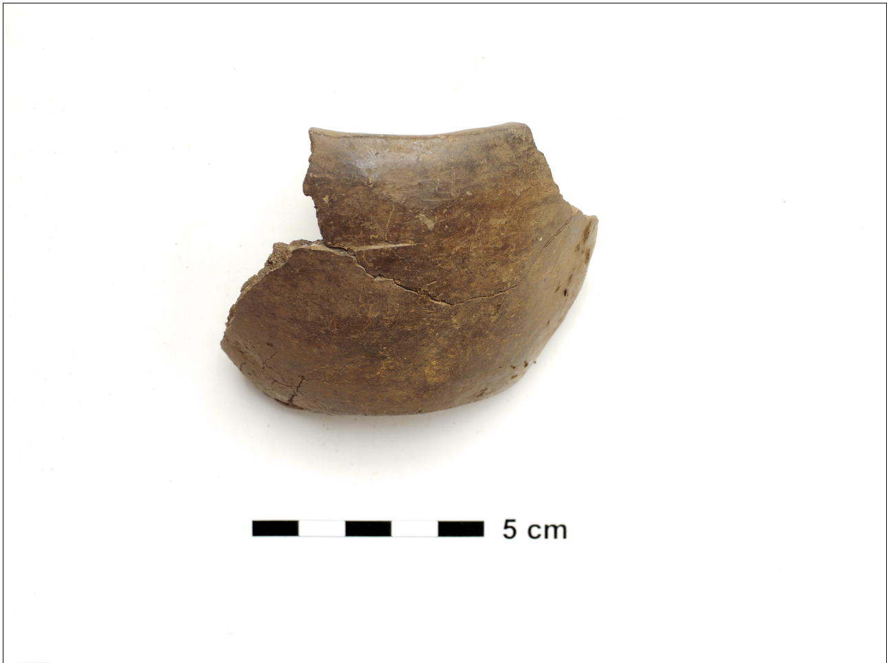
Figuur 8.1.5.54. Eelde, Groote Veen. Vondstnummer 517/1498: type S5, laat romeins. Dit model komt tot dusver niet in noord-Drenthe voor (mond. mededeling E. Taayke).