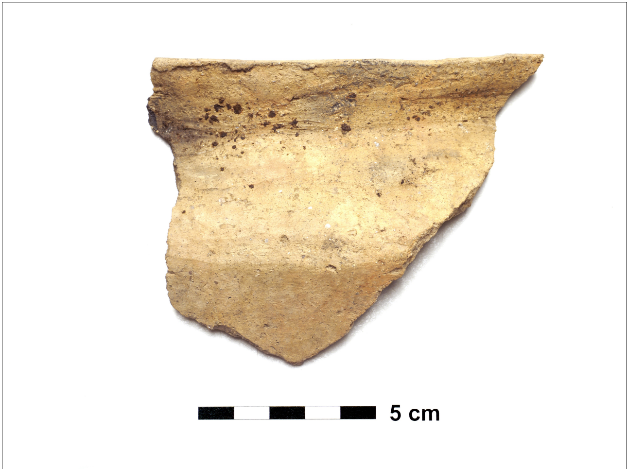
Figuur 8.1.5.11. Eelde, Groote Veen. Vondstnummer 4461/1036: RheinWeserGermaans, type Ede B2 met knikwand, vroeg tot midden romeinse tijd.