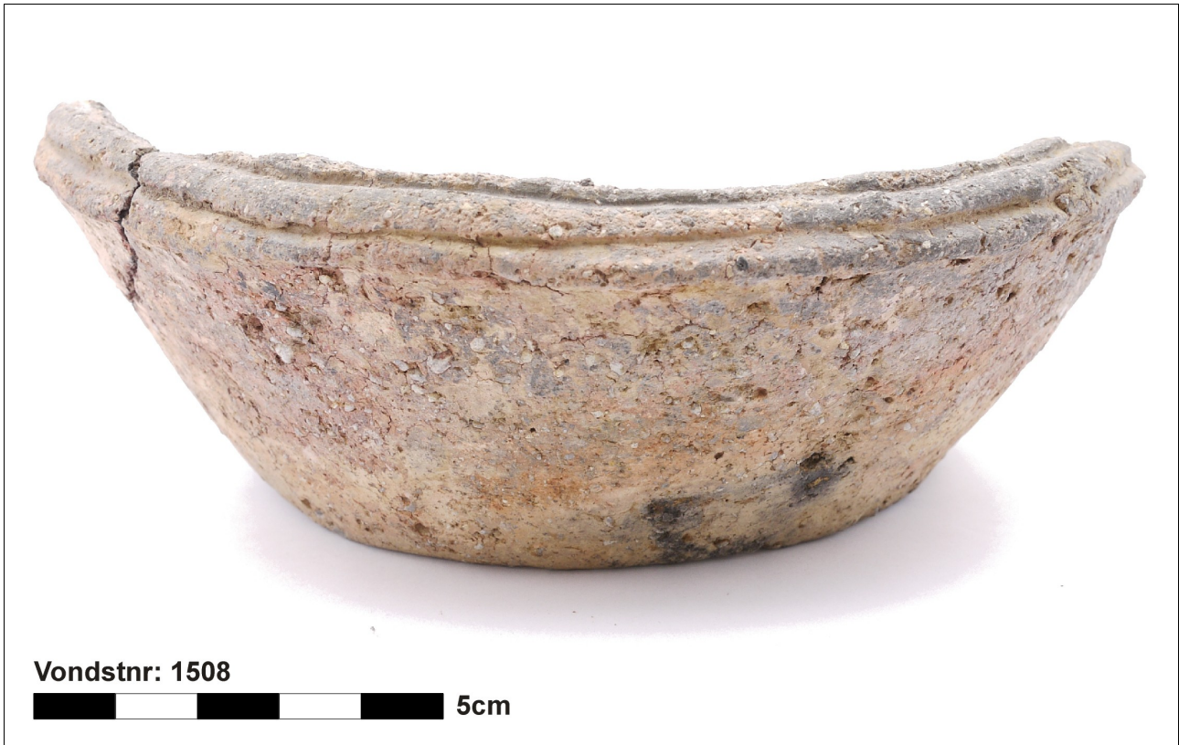
Figuur 8.1.5.47. Eelde, Groote Veen. Vondstnummer 1508.