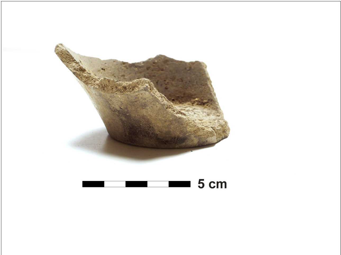
Figuur 8.1.5.55. Eelde, Groote Veen. Vondstnummer 700/? : bodem met een gladde binnen- en buitenkant, laat romeins (chrono-groep 13).