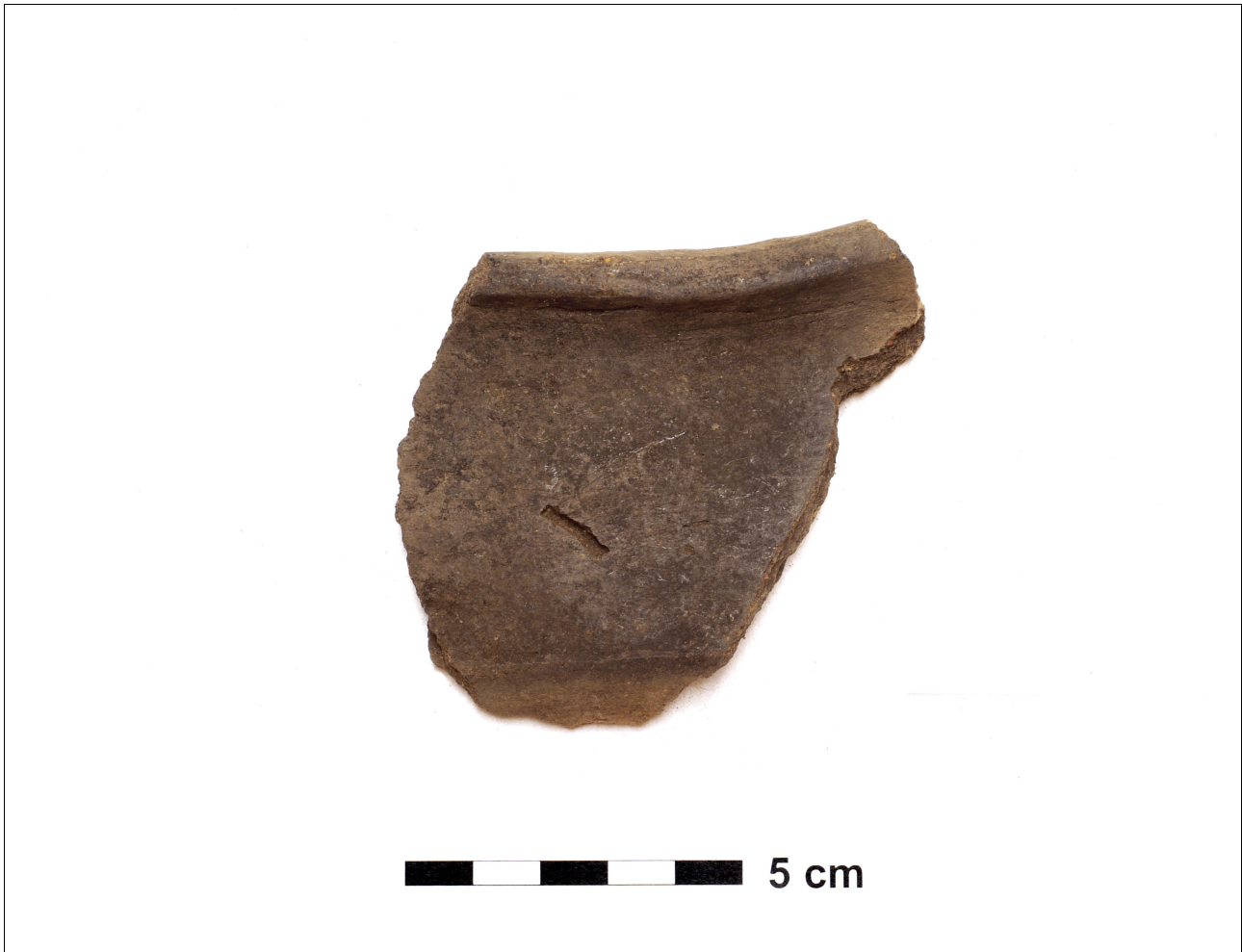
Figuur 8.1.5.13. Eelde, Groote Veen. Vondstnummer 4590/1018: RheinWeserGermaans-achtig, type Ede B2, vroeg romeinse tijd. Deze pot heeft een scherpe buikknik.