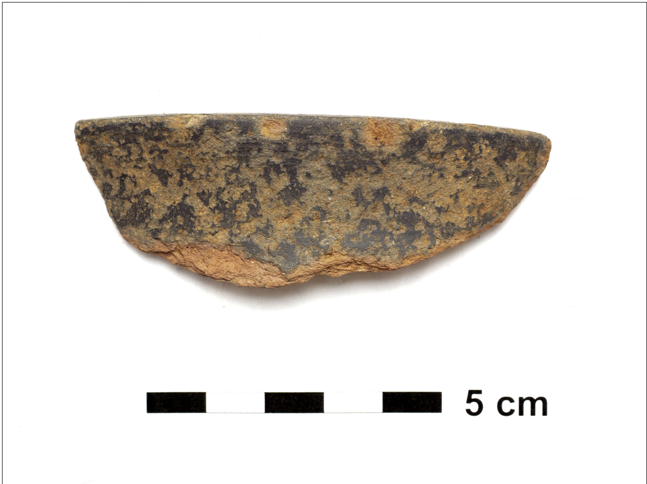
Figuur 8.1.7.2. Eelde, Grote Veen. Vondstnummer 821/1483: rand van terra nigra -achtig aardewerk uit de midden tot laat romeinse tijd (chrono-groep 13).