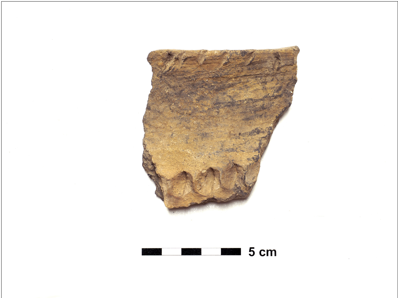
Figuur 8.1.5.14. Eelde, Groote Veen. Vondstnummer 1156/1653: RheinWeserGermaans: type Ede C3, vroeg tot midden romeins. De versiering bestaat uit nagel-indrukken op de rand en vinger-indrukken op de schouder.